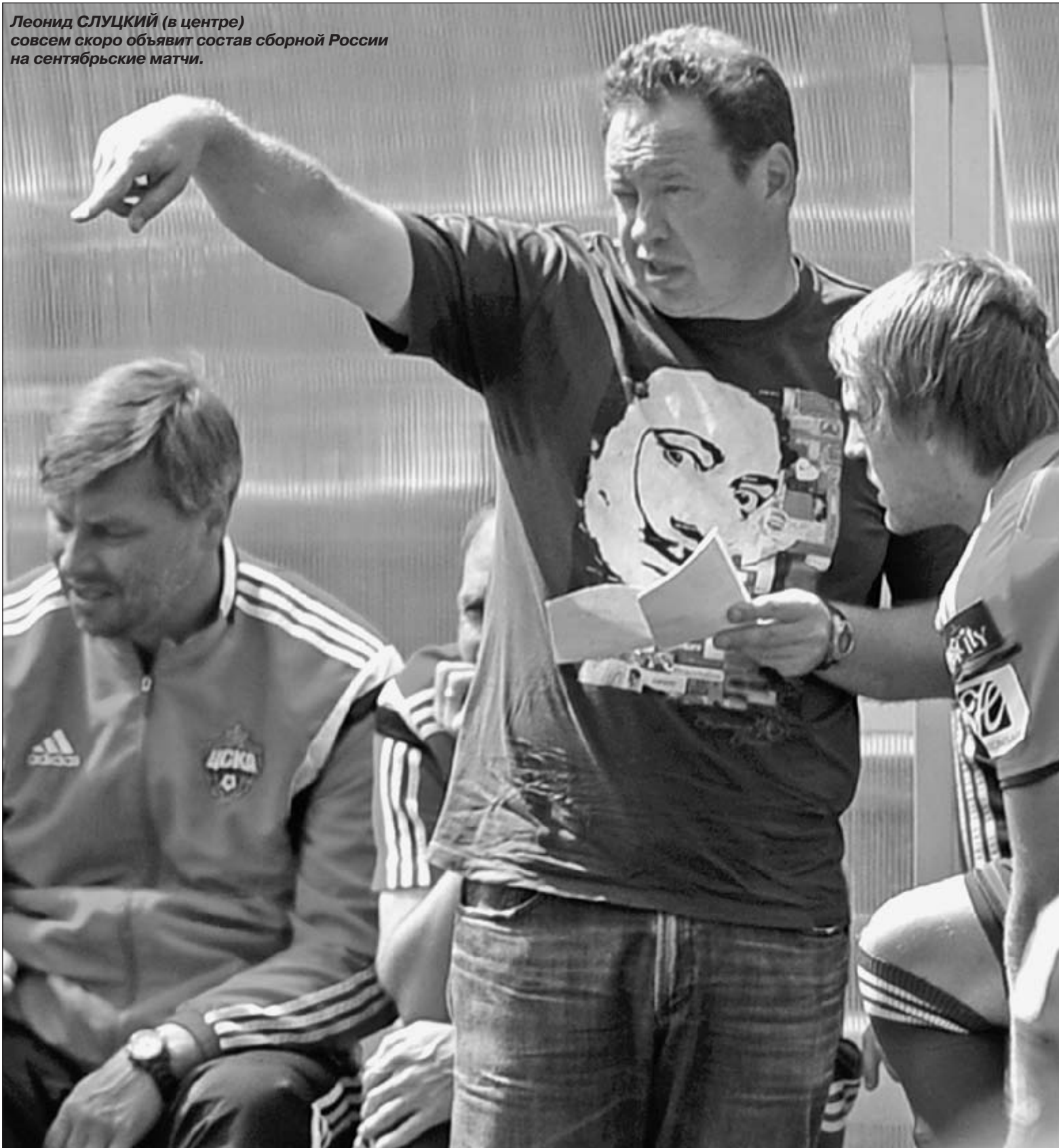
Леонид СЛУЦКИЙ (в центре) совсем скоро объявит состав сборной России на сентябрьские матчи.