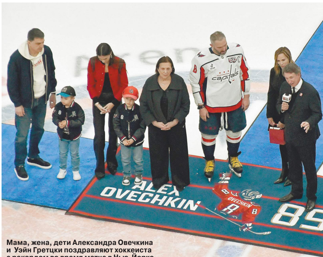
Мама, жена, дети Александра Овечкина и Уэйн Гретцки поздравляют хоккеиста с рекордом во время матча в Нью-Йорке.