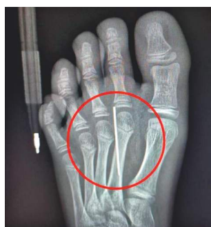
Увлечение сериалом «Игра в кальмара» привело школьника из Подмоскovie

на больницу койку. Мальчик вырезал иголкой печенку по контуру и по неосторожности наступил на острый аксессуар.