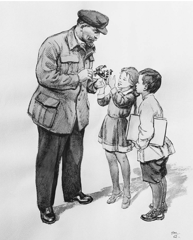
Отношение россиян к Ильичу сегодня не такое, как в советские годы. Репродукция художника Николая Жукова «Ленин и дети»

На сайте goodbyelenin.ru 70 процентов посетителей проголосовали за предание тела вождя земле