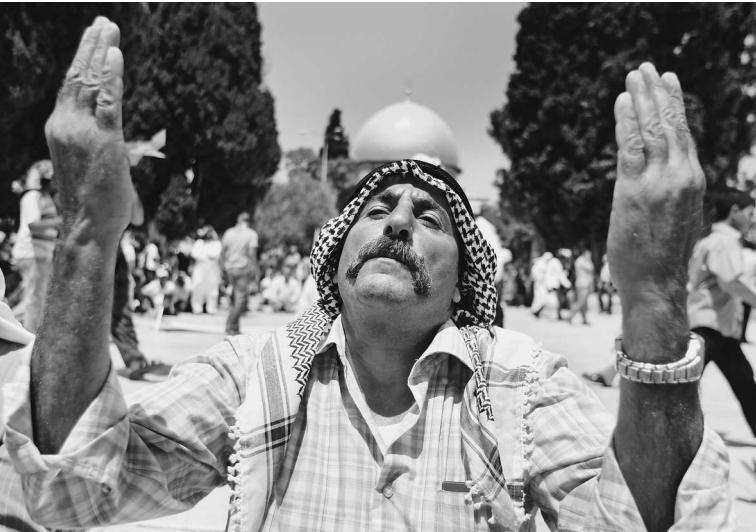
За спиной молящегося палестинца — мусульманская святыня, мечеть Аль-Акса на Храмовой горе. Вопрос о статусе Восточного Иерусалима по-прежнему открыт