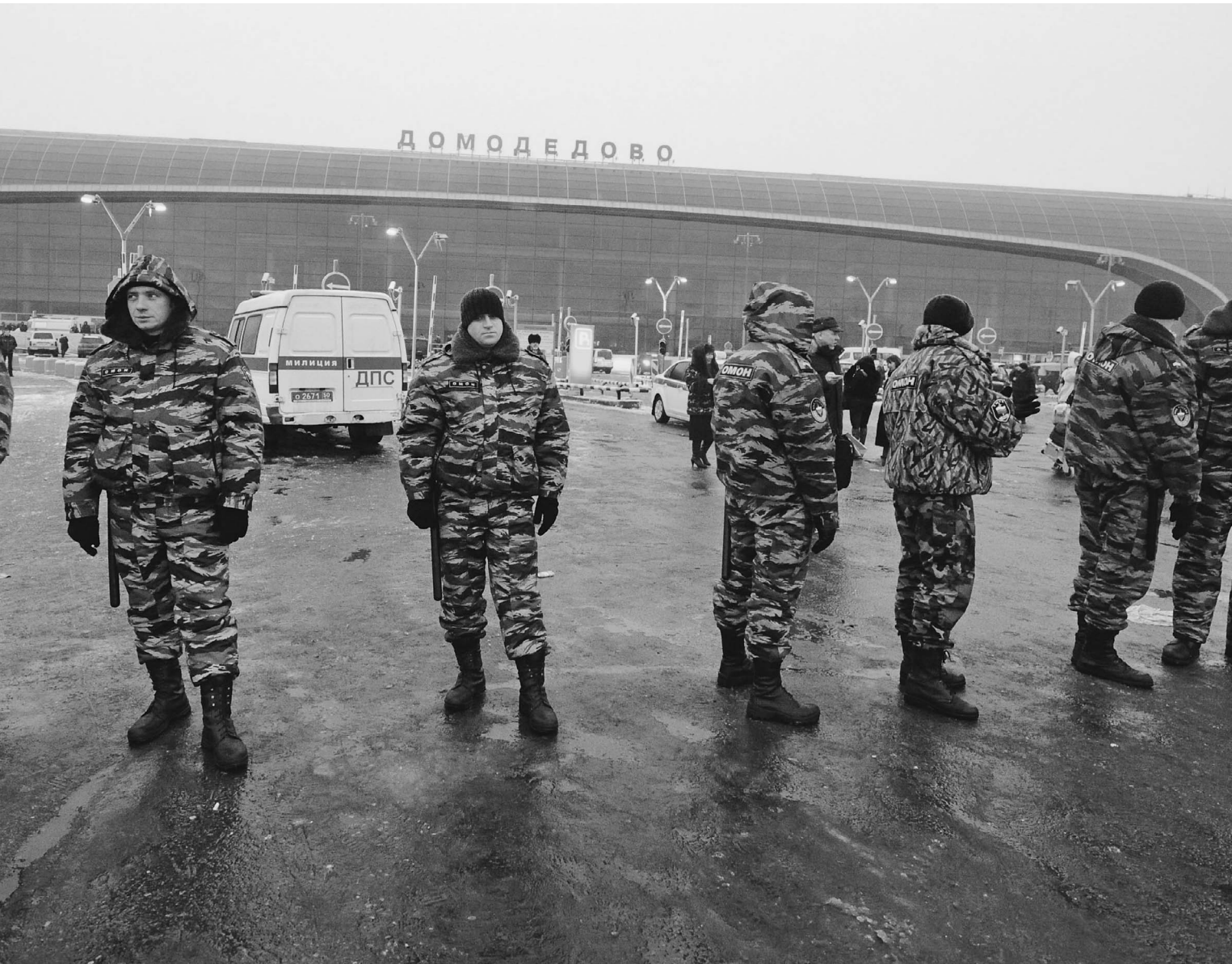
На момент подписания номера в здании аэропорта «Домодедово» работали следователи

Смертник подорвал себя в московском аэропорту: 31 погибший