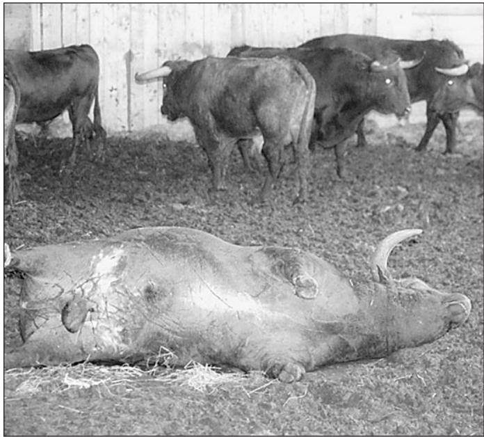
Этот бык так и не вышел на арену