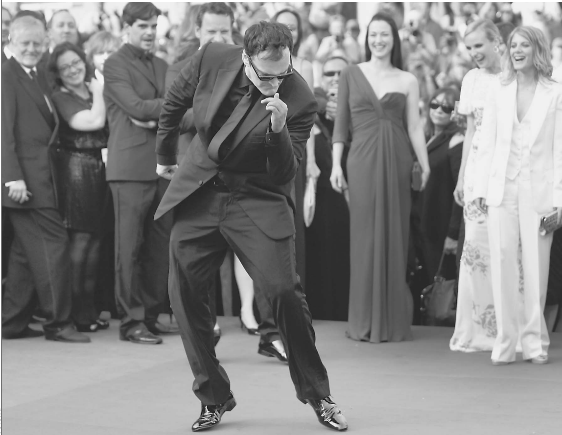
Победный танец Квентина Тарантино : перед триумфальной премьерой «Бесславных ублюдков»

Каннский фестиваль представил одного из фаворитов конкурсного показа — картину Квентина Тарантино «Бесславные ублюдки». Конкуренцию ему составили «Разорванные объятия» в постановке еще одного кумира киноманов Педро Альмодовара и «Пророк» французского режиссера Жака Одиара. → стр. 10