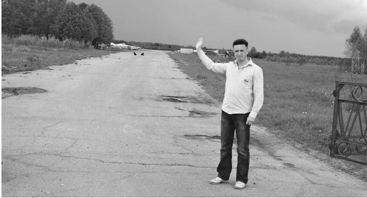
...и эти препятствия корреспондент «Известий» преодолел без труда