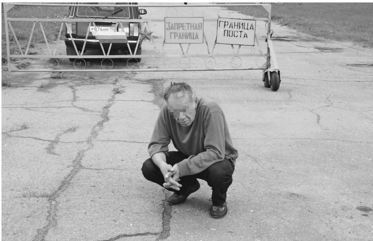
Охрана некогда закрытого объекта теперь состоит из «чоповца»...

В планах бизнесмена — создать первый в России полноценный аэропорт для бизнес-авиации. Сейчас бизнес-перевозки между собой делят «Внуково», «Домодедово» и «Шереметьево», где располагаются всего лишь бизнес-терминалы. Идею максимум — сконцентрировать все в одном месте. «Нафта-Москва» уже создала под проект дочернюю структуру — ЗАО «Аэропорт Кубинка» и намерена до конца года вывести за свой счет военную базу с территории аэродрома. Впрочем, вывод уже состоялся. В чем и убедились «Известия». → стр. 3