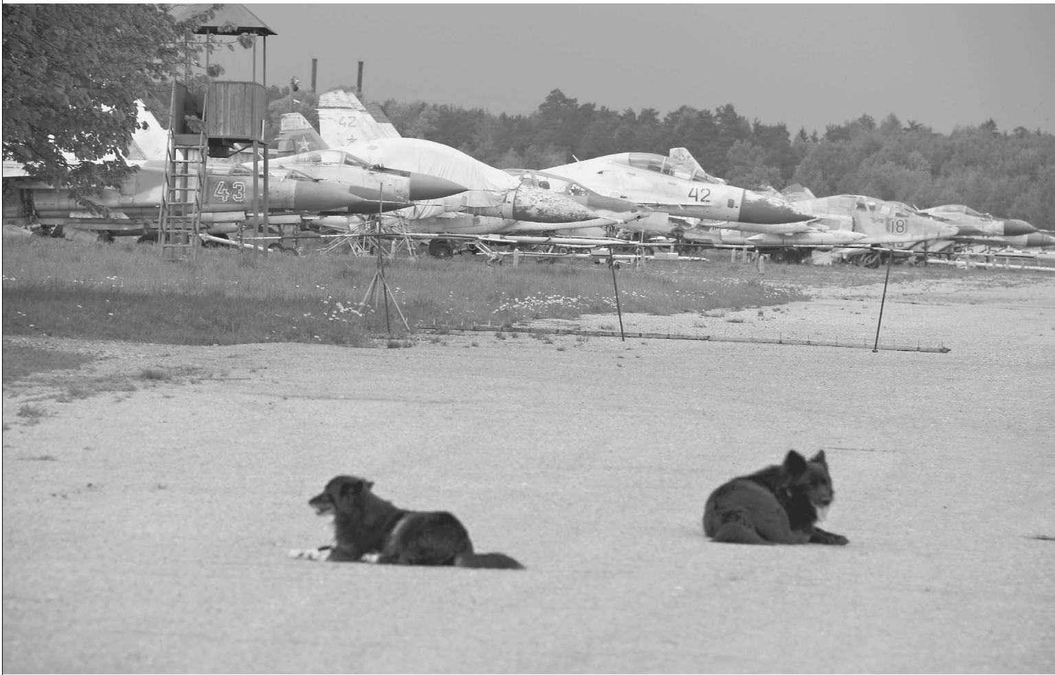
Военный аэродром Кубинка до 1 декабря должен переехать с привычного места

Какая судьба ждет легендарный военный аэродром?