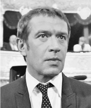
Владимир Машков выступает в Народный фронт