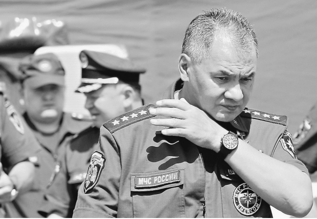
Руководитель МЧС Сергей Шойгу