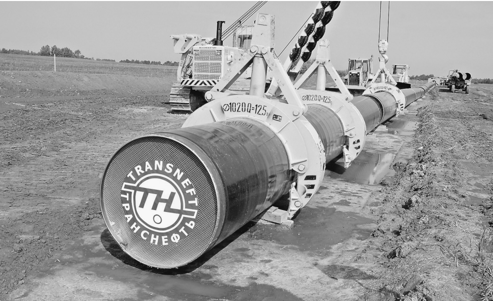
Предложения по продаже акций трубопроводной монополии, имеющей стратегическое значение для страны, могут вызвать у многих в правительстве возражения

Самих инвесторов планируется оценивать «по качествен-