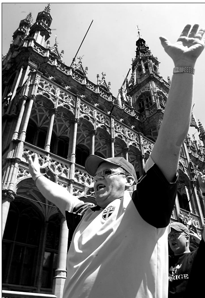
Вчера, Брюссель. Для болельщиков из Швеции, команда которых встретится сегодня в матче открытия с бельгийцами, праздник уже наступил.

Эту клятву нам навязали власти Бельгии и Голландии - оргкомитет хотел в интересах семейных людей разрешить приобретение одному лицу четырех билетов. Но правоохранительные органы опасаются возникновения на трибунах активных групп. Кроме того, национальные федерации передали нам именитые списки лиц, приобретших билеты. Это не всем понравилось, но конфиденциальность нами гаран-