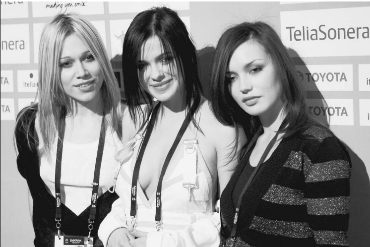
Третье место, занятое «СЕРЕБРОМ», обеспечило России автоматический выход в финал «Евровидения-2008»

«Не важно, какое место мы здесь займем, — пояснили «серебрянки» в беседе с обозревателем «Известий» накануне финала. — Главное, чтобы нам не было стыдно перед государством». Желание девочек сбылось. Государство журить их не станет. Напротив, обратит теперь на «Серебро» — хотя бы ненадолго — пристальный взгляд. → стр. 10