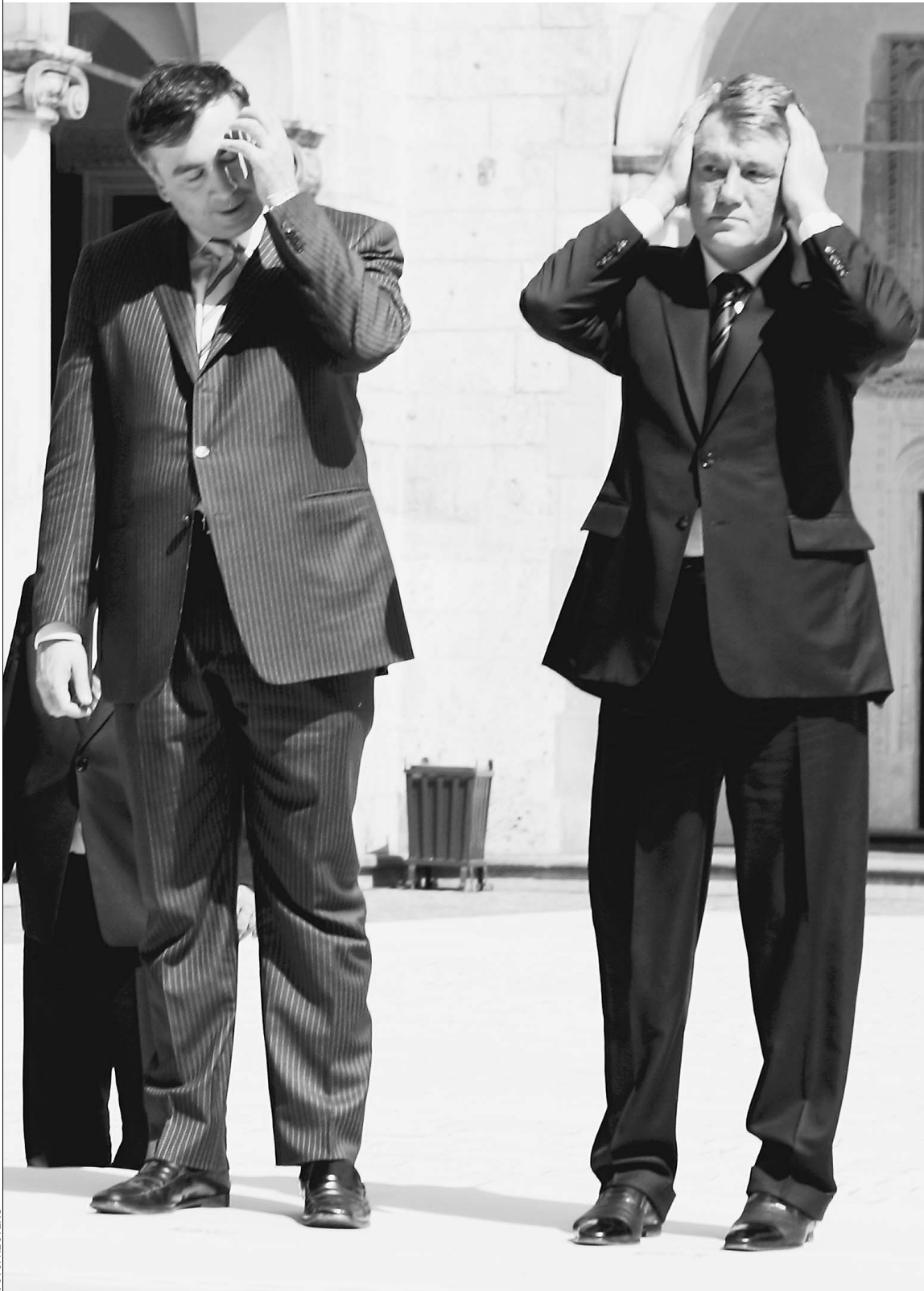
Михаил Саакашвили и Виктор Ющенко: есть над чем задуматься

Газовые соглашения России, Туркмении и Казахстана расстроили планы участников альтернативного «энергетического» саммита