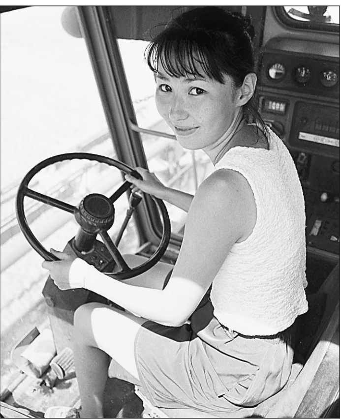
Земельный вопрос решат молодые