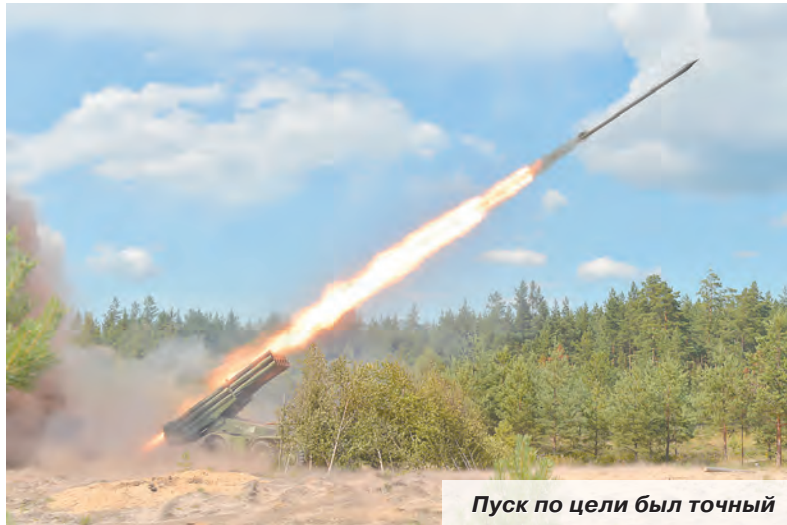
Пуск по цели был точный

В другой день учения военнослужащие в составе экипажей и боевых расчётов огнёмётных систем ТОС-1А «Солнцепёк» провели пуски 220-мм неуправляемых реактивных снарядов с термобарической боевой частью по целям на удалении три километра. При выполнении боевой стрельбы поражены мишени, имитировавшие тактический десант условного противника.