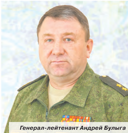
Генерал-лейтенант Андрей Булыга

округа на полуостров в начале июля было направлено подразделение из отдельной бригады МТО, дислоцированной в Нижегородской области. Задача подразделения – монтаж трубопровода из восьми линий протяжённостью 28 км (посёлок Верхние Орешки – Симферопольское водохранилище). Общая протяжённость водовода – 224 км. Для подачи воды по трубопроводу установлены передвижные насосные станции,