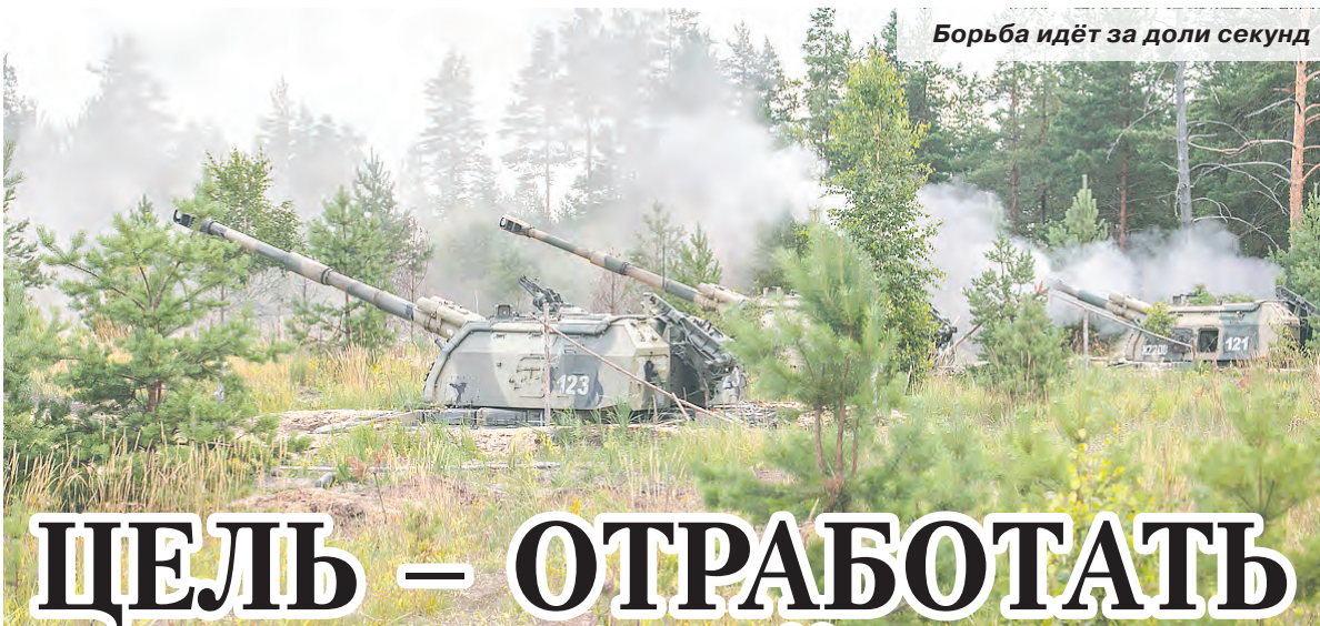
Борьба идёт за доли секунд