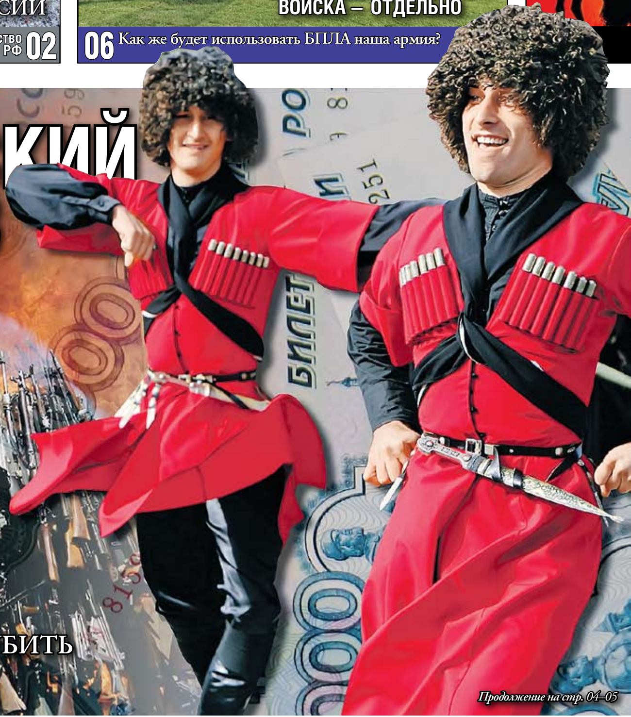
Коллаж Андрея СЕДУХА (PHOTOPRESS)

К СОЖАЛЕНИЮ, ЕГО НЕ УДАТСЯ РАЗРУБИТЬ ОДНИМ УДАРОМ