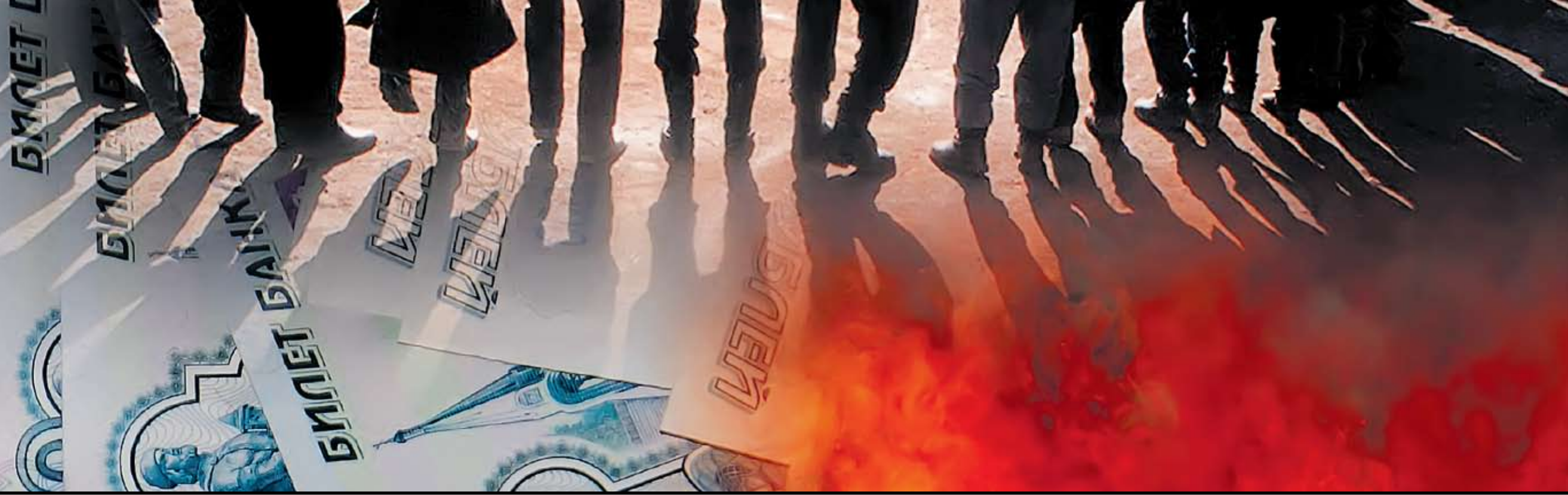
Коллаж Андрей СЕДИХ

Возможности для сдерживания нового конфликта на Северном Кавказе будут ограниченными, поскольку его масштабы могут превысить все предыдущие конфликты в новейшей российской истории. Ограничивающими факторами для эффективного применения силы на Кавказе послужат неготовность российского общества к новым человеческим жертвам и возросшие возможности международного давления на Россию.