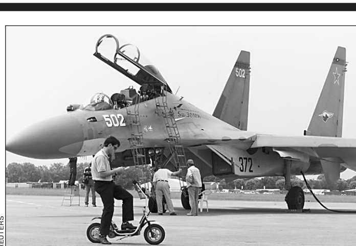
Су-30 на площадке Ле Бурже. Дата взлета — под вопросом