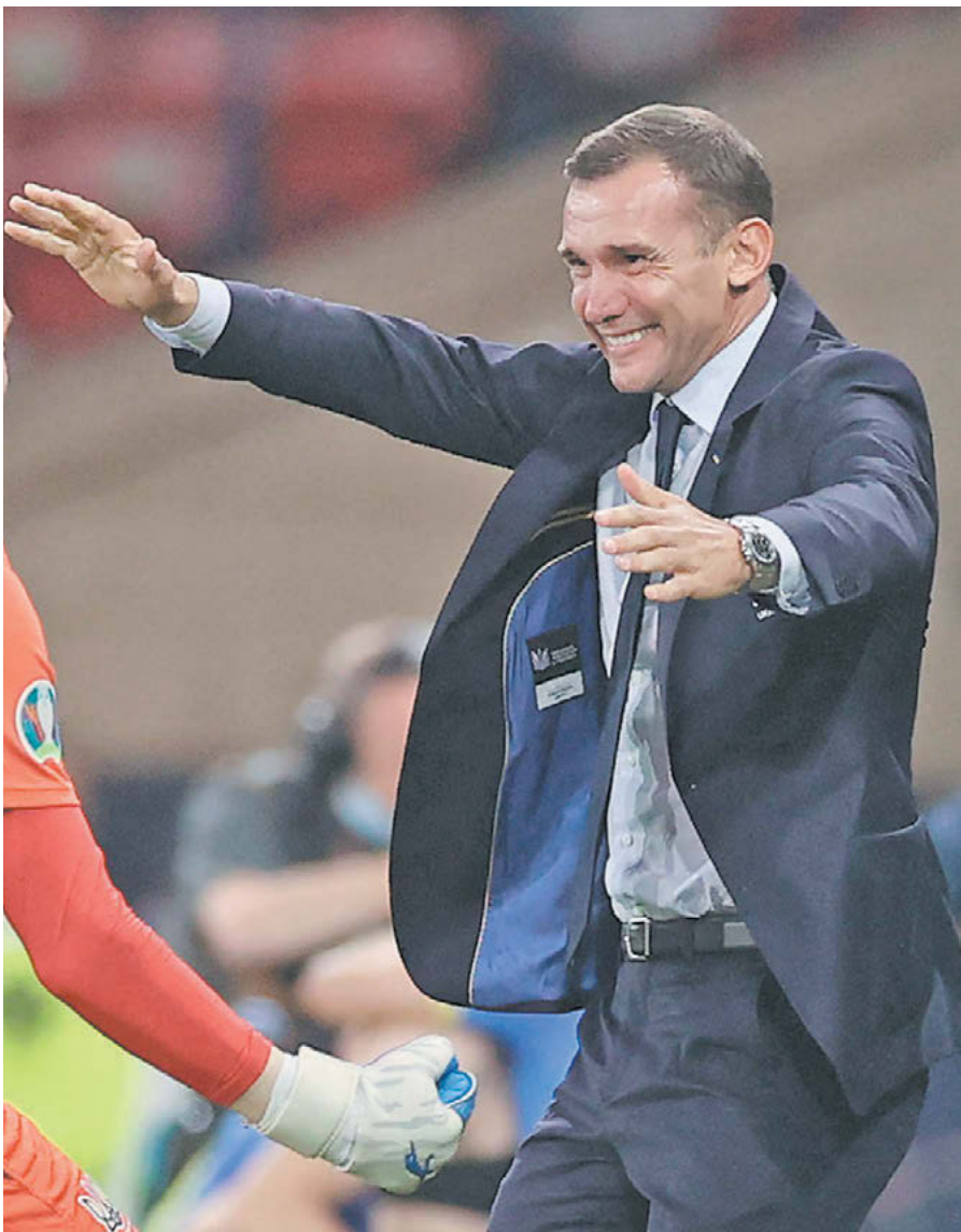
Вчера. Глазго. Швеция – Украина – 1:2. Главный тренер сборной Украины Андрей Шевченко

Сборной Украины для выхода в плей-офф пришлось дожидаться итогов остальных групп. Самостоятельно команда Андрея Шевченко с задачей не справилась, в последнем туре уступив австрийцам. Та игра у жовто-блакитных категорически не заладилась: они не смогли ничего противопоставить хорошо организованному и физически крепкому сопернику.