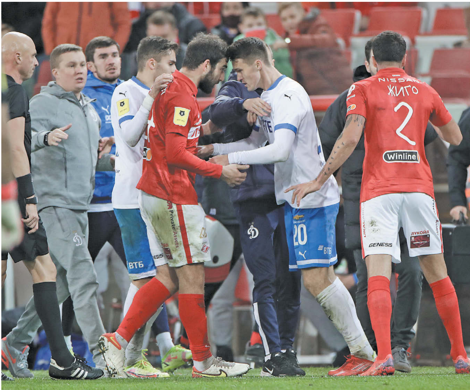
Суббота. Москва. Тушино. «Спартак» – «Динамо» – 2:2. 42-я минута. Так начиналась драка стенка на стенку

11-й тур чемпионата России подарил немало ярких матчей, а его жемчужиной стала битва «Спартака» с «Динамо» (2:2)