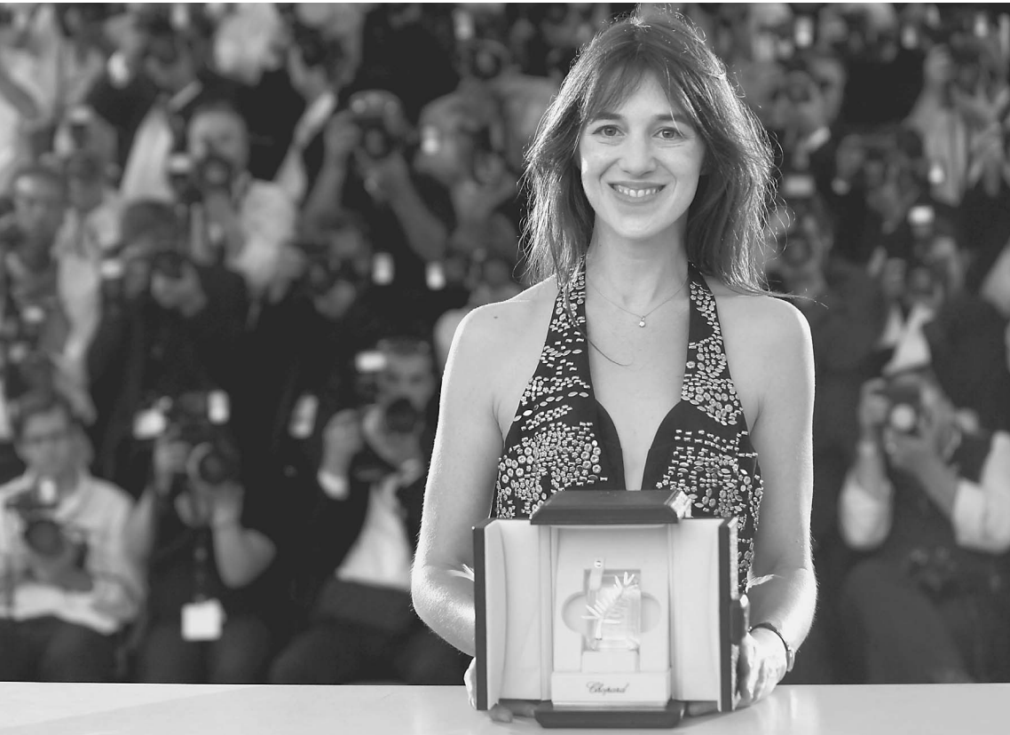
ШАРЛОТТА ГИНСБУР , сыгравшая в «Антихристе» Ларса фон Триера, получила свою награду вопреки скандалу, разразившемуся вокруг самого фильма

«Мы действительно не знаем, кого сегодня назовут победителями!» — уверяли французские телеведущие на красной дорожке перед самым началом заключительной церемонии. Кани-2009, собравший рекордное количество звездных имен и лауреатов «Золотых ветвей» минувших лет, сумел сохранить интригу до конца. Полный список победителей стал известен лишь в воскресенье поздно вечером. И абсолютно предсказуемым его не назовешь. → стр. 10