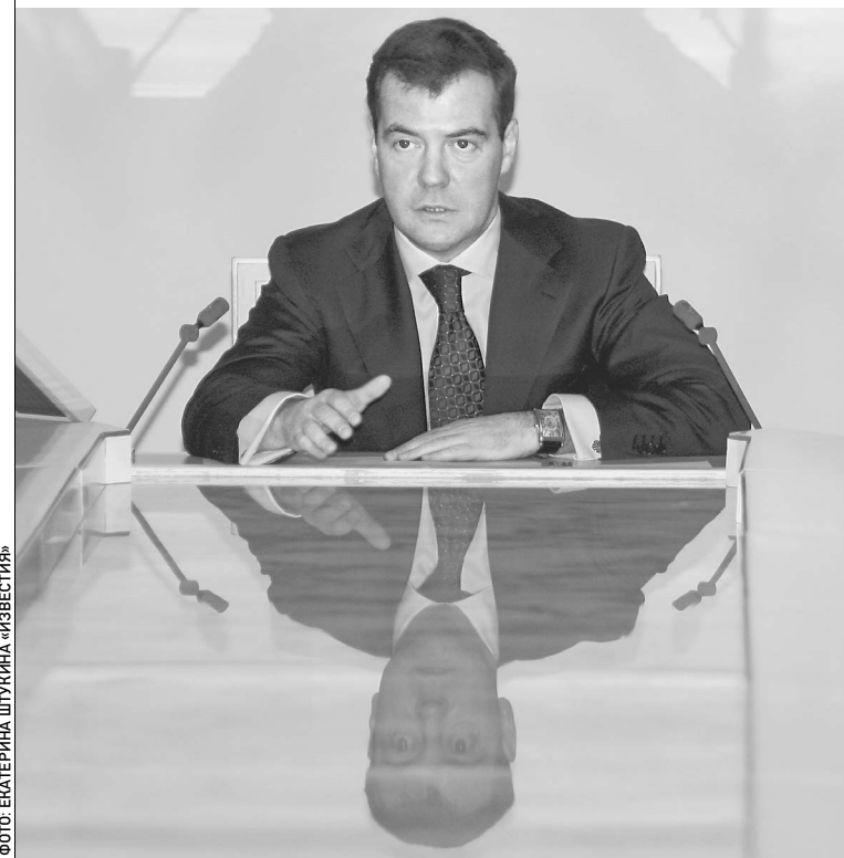
ДМИТРИЙ МЕДВЕДЕВ хочет видеть отдачу от каждого рубля

— Здесь находится те, от кого зависит реализация Бюджетного послания, — Медведеву было важно обратиться не к близким Белому дому, Госдуме и Совету федерации, а к конкретным людям. → стр. 2