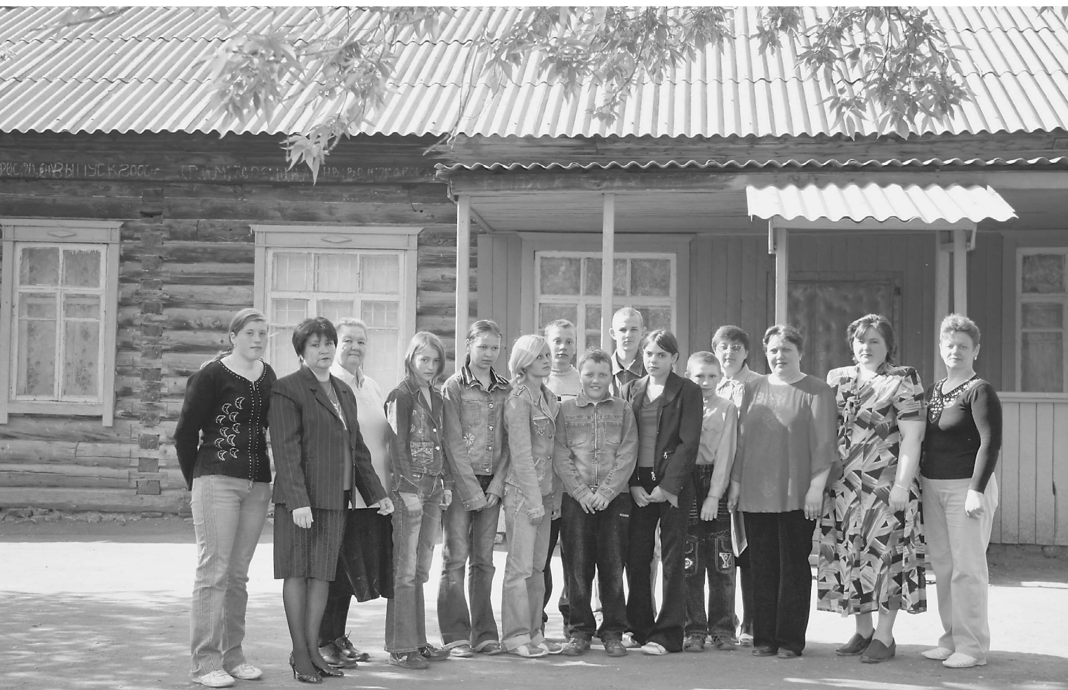
Ученики и учителя ГРУДЬЮ встали на защиту родной школы

Это берется доказать наш собственный корреспондент по Алтаю Сергей Тепляков