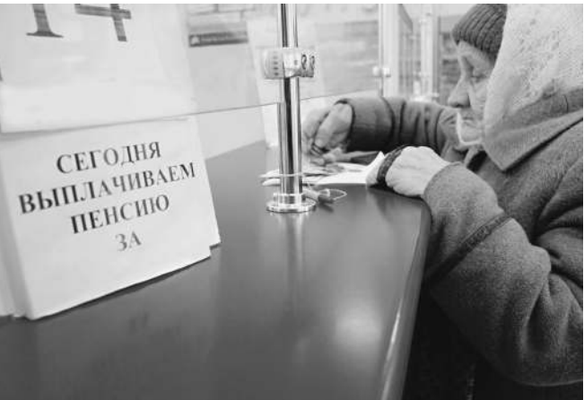
Действующая пенсионная система не удовлетворяет ни пенсионеров, ни власти