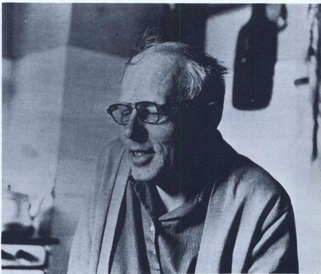
Андрей Дмитриевич Сахаров

ЕЖЕМЕСЯЧНЫЙ ОБЩЕСТВЕННО-ПОЛИТИЧЕСКИЙ ЖУРНАЛ