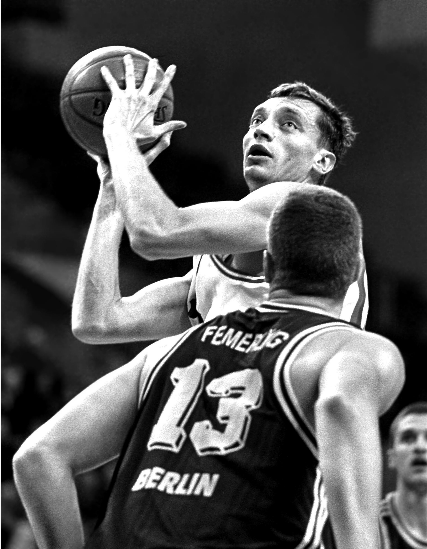
Вчера. Москва. ЦСКА - «Альба» - 86:75.