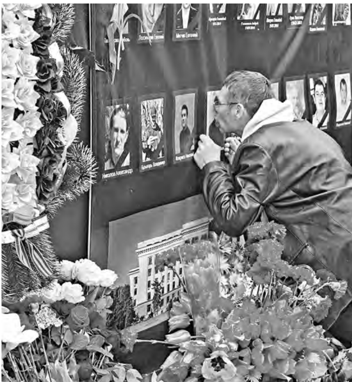
Винными в трагедии в Одессе власти выставили погибших.