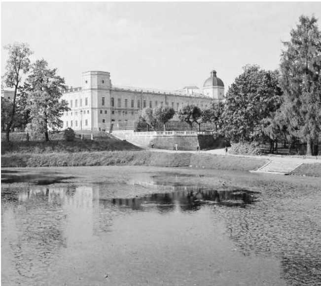
Соседство с реактором может стоить Гатчинскому дворцу административной независимости