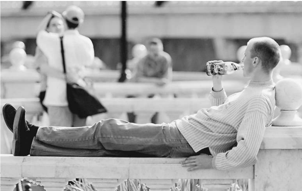
Многим придется пересмотреть привычные формы досуга