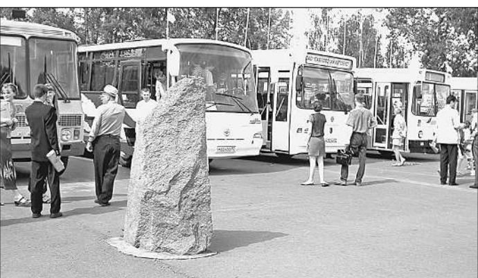
8 июня. Красноярцы любопытствуют: преодолит ли пятёрка новых российских автобусов трудные сибирские дороги?

В Красноярске — 30-градусная жара. Лица проехавших автоколонну — чиновников и бизнесменов, которые раскручивают новую технику с целью ее внедрения в транспортное хозяйство муниципалитетов, — цвета сырой говядины, но они были уверены в том, что вся пятёрка доберется до финиша без потерь. Оптимизм оправдан: автобусы пришлось срочно гнать своим ходом в