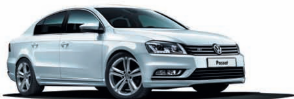
Passat R-line (Р-лайн)

Самый приятный выбор – это выбор между хорошим и отличным. Благодаря многообразию вариантов комплектаций, представленных в салонах официальных дилеров, вы можете выбрать и приобрести именно такой Volkswagen Passat, о котором всегда мечтали. Тем более что только сейчас действуют специальные цены.