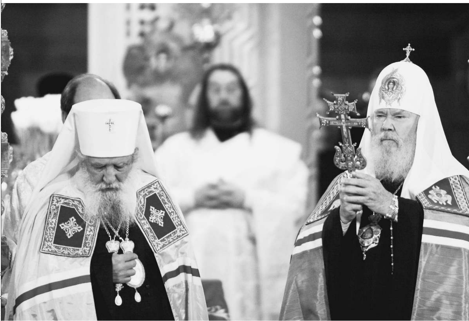
Митрополит Лавр и Патриарх Алексий II: гражданская война окончена

Русская православная церковь преодолела долгий и мучительный раскол