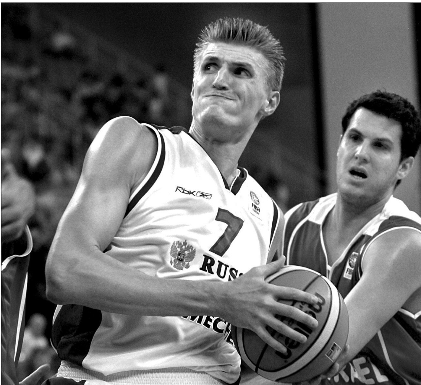
Вчера. Гранада. Россия - Израиль - 90:56. В атаке - лучший игрок матча Андрей КИРИЛЕНКО.

Вчера сборная России одержала победу и во втором матче ЧЕ-2007, разгромив израильтян. Лучшим в составе нашей команды был ее капитан Андрей Кириленко: 17 очков, 13 подборов, 5 голевых передач, 2 перехвата и 2 блок-шота! Сегодня россияне встречаются с действующим чемпионом Европы – сборной Греции. Независимо от результата этой игры они вышли во второй этап первенства – первыми из 16 его участников.