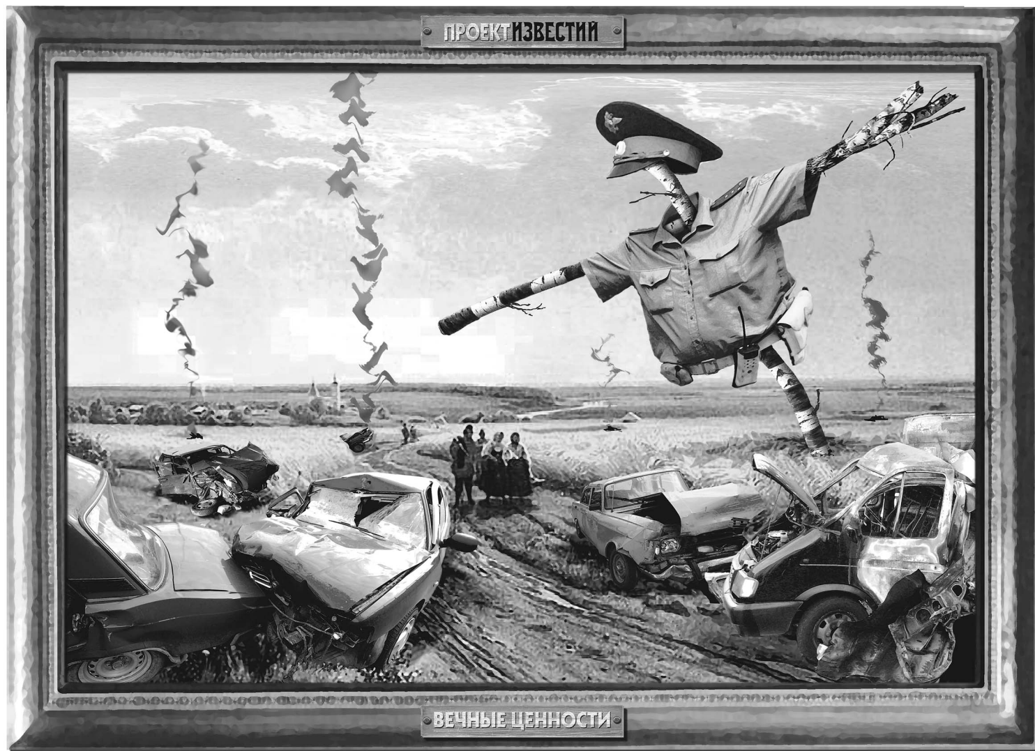
Дороги России. Иллюстрация Константина Валова по мотивам фрагмента картины художника Ивана Шишкина «Полдень в окрестностях Москвы» (1869 г.)

Меньше месяца продержалось равноправие на дорогах между работниками прокуратуры и простыми смертными. Казалось, с 1 сентября, после вступления в силу нового регламента борьбы с правонарушителями на дорогах, эпоха дорожных привилегий заканчивается. Однако Генпрокуратура оспорила решение МВД, позволяющее привлекать высокопоставленных персон на общих основаниях.