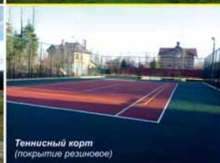
Теннисный корт (покрытие резиновое)