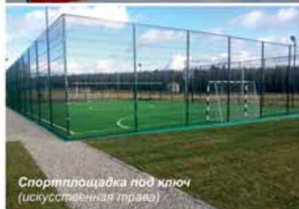
Спортплощадка под ключ (искусственная трава)