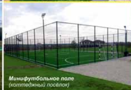
Минифутбольное поле (коттеджный посёлок)