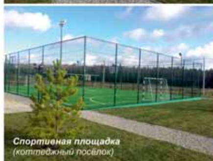
Спортивная площадка (коттеджный посёлок)