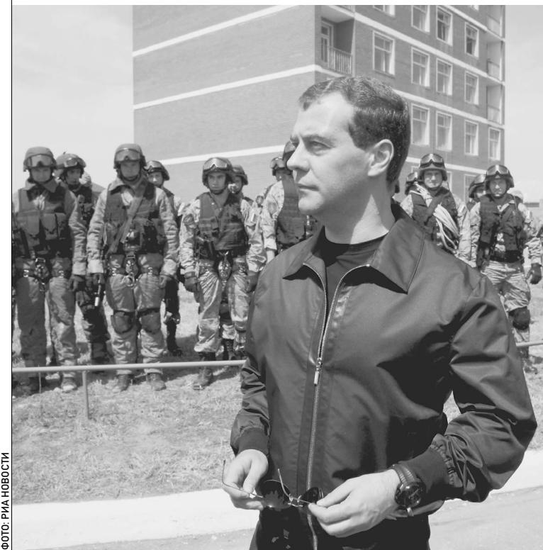
9 июня. Президент России Дмитрий Медведев в Центре специального назначения ФСБ

ботал. По той же причине глушится мобильная связь. А тех счастливых, которым удалось дозвониться, — прослушивают. Об этом сообщает специальный значок на моем телефоне. Милиционеры с автоматами наперевес расставлены на каждом перекрестке. → стр. 2