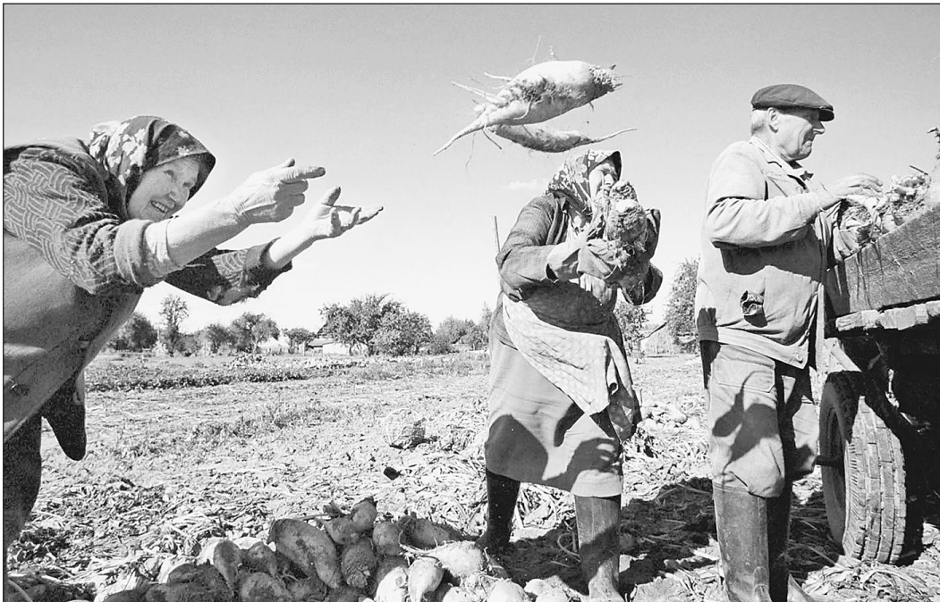
...так и позжемь

Площади сева основных зерновых культур в хозяйствах всех видов собственности. 1990-й — 63,1 млн га, 1995-й — 54,7 млн га, 1996-й — 53,4 млн га, 1997-й — 53,6 млн га, 1998-й — 50,7 млн га, 1999-й — 46,6 млн га, 2000-й — 45,9 млн га. (Источник — экспертно-консультационный центр «СовЭкон»).