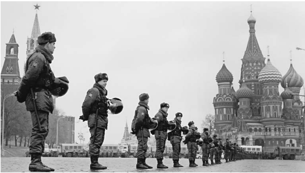
10 декабря Красная площадь была блокирована, но туда никто и не рвался

— Болотная площадь — место, крайне неудобное своей физической конфигурацией. Это длинная узкая «кишка», и поэтому звук, установленный на сцене, на середине площади уже не был слышен. Мы хотим иметь площадку, квадратную по форме. Чтобы тем, кто пришел на митинг, было удобно, комфортно,