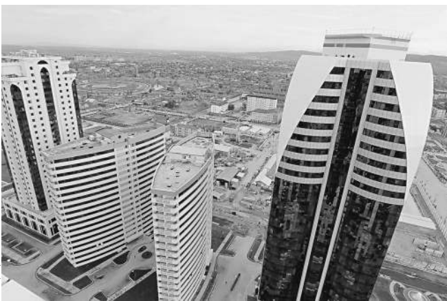
Грозный-сити уже стал визитной карточкой города