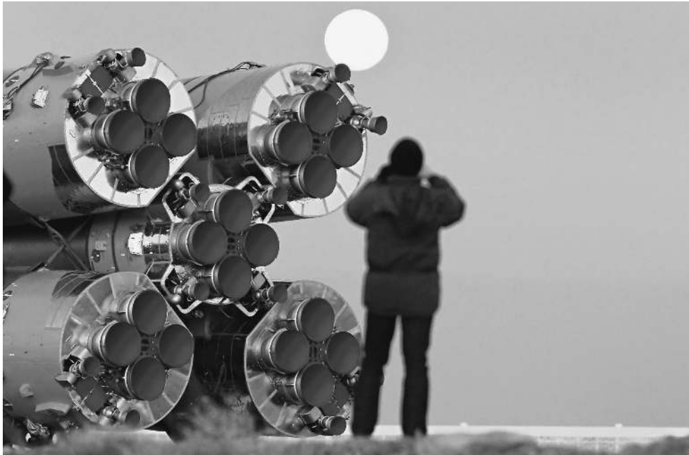
«Союзы» ждут новых стартовых столов

ФЗ-93 принимался в мае 2009 года, чтобы максимально ускорить процесс строительства инфраструктуры на острове Русский к саммиту: моста, дорог, международного делового центра, гостиниц, океанариума и Тихоокеанского научно-образовательного центра РАН. Чтобы строительство велось без задержек и при этом застройщик не испытывал проблем с