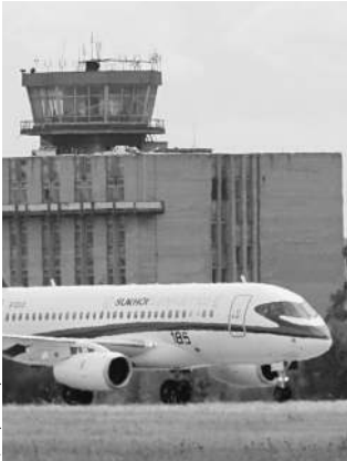
Попавшие в эксплуатацию «суперджетов» на полную мощность не работают

DJIA 12021.39 ▼ NASDAQ 2612.26 ▼ MMVB 1359.48 ▲ PTS 1369.47 ▲ НЕФТЬ BRENT 107.76 ▲ ЗОЛОТО 1669.06 ▲ €/РУБЛЬ 41.79 ▼ $/РУБЛЬ 31.6704 ▲