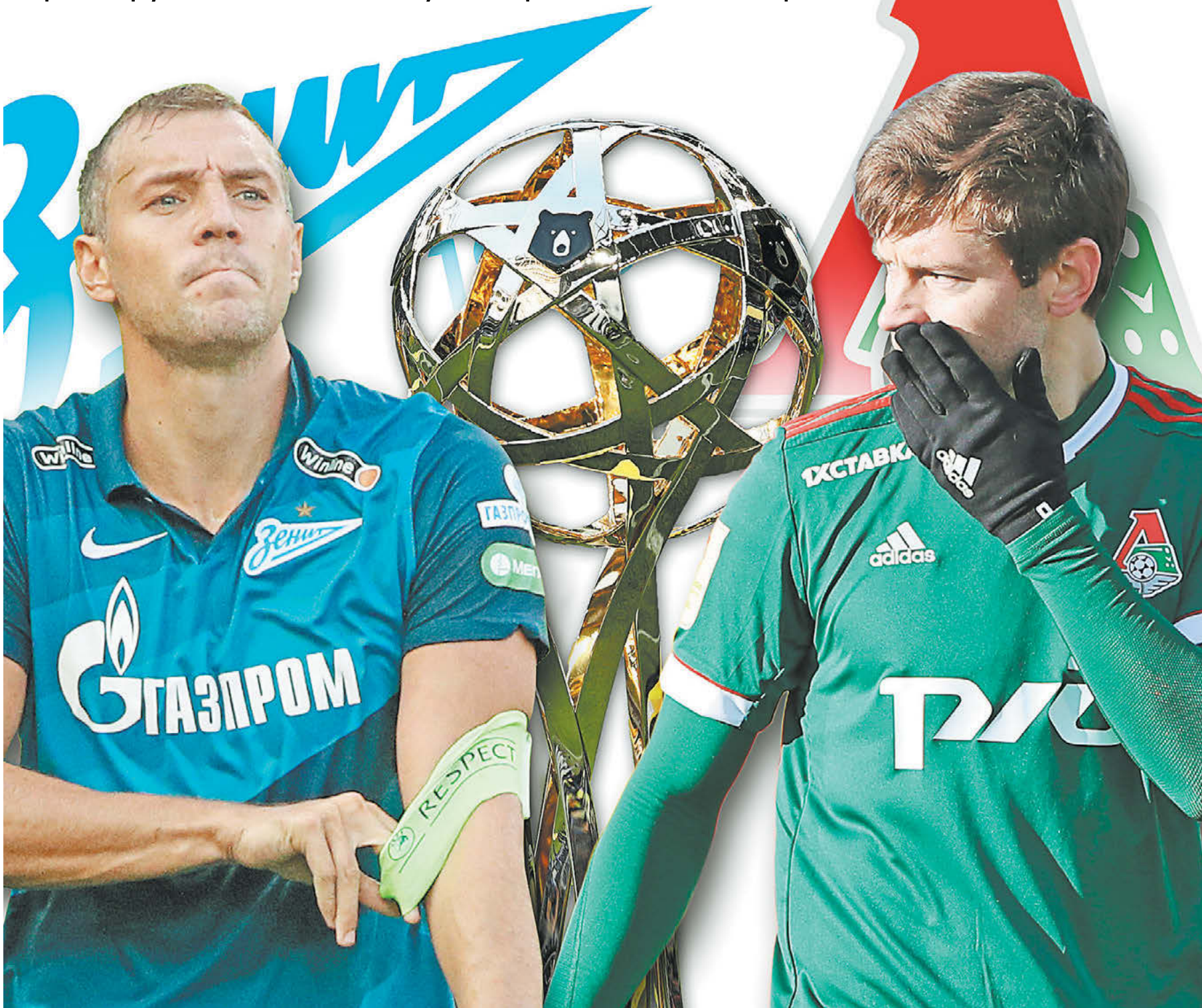
Форвард «Зенита» Артем Дзюба

Победа в воскресном матче с железнодорожниками гарантирует сине-бело-голубым третье золото подряд