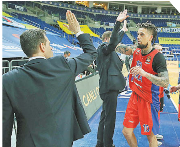
Turkish Airlines Euroleague