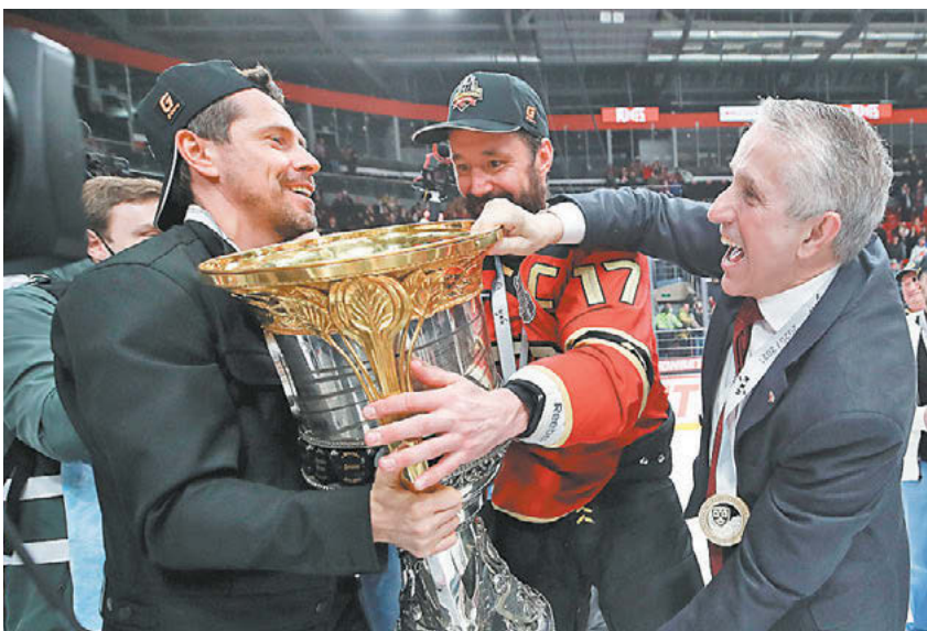
Среда. Балашиха. «Авангард» – ЦСКА – 1:0.

Источником информации об одобрении основных рисков игр, пари является сайт 000 «Управляющая компания НКС» в сети интернет по адресу winline.ru Реклама 18+