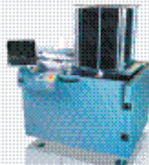
Автоматический разгрузчик BR 01