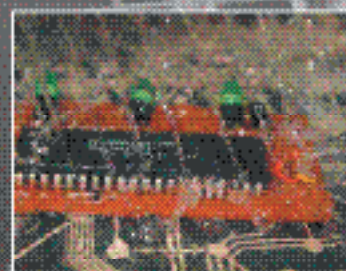
Очистка печатных узлов ответственной радиоэлектронной аппаратуры