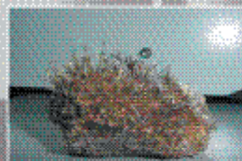
Как справиться с примесями при пайке волной припоя