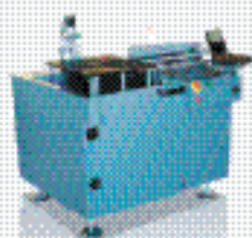
Автоматический загрузчик BZ 01