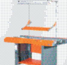
Ремонтная станция B1R