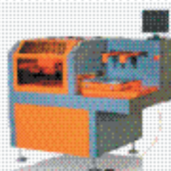
Полуавтоматический принтер B70