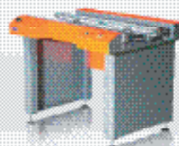
Конвейерная система B2b