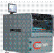
Автоматический принтер траферетной печати «Буря» B100