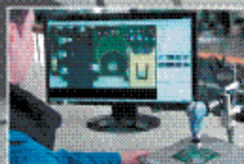
Визуальный контроль качества пайки с помощью видеомикроскопа

Управляющая фирма «ДИАЛ» - Компания 427411, Россия, Дзержинское шоссе, д.157, стр.10, 10-й этаж Тел./факс: +7 (800) 227-83-27, 800-20-20, 700-20-20. E-mail: info@diplace.ru