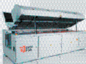
Печь конвекционного оплавления RENN VXs air 2100 (тип 421)