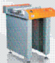
Конвейерная система B1b