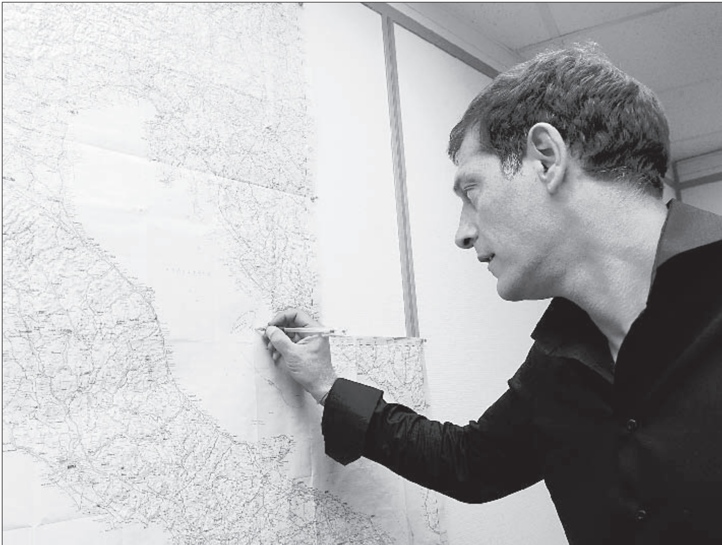
Вчера. Москва. Редакция «СЭ». Главный тренер «Локомотива» Славен БИЛИЧ оставляет автограф на карте, возле родного города Сплита.

Полностью интервью с главным тренером «Локомотива» Славеном Биличем - в одном из ближайших номеров