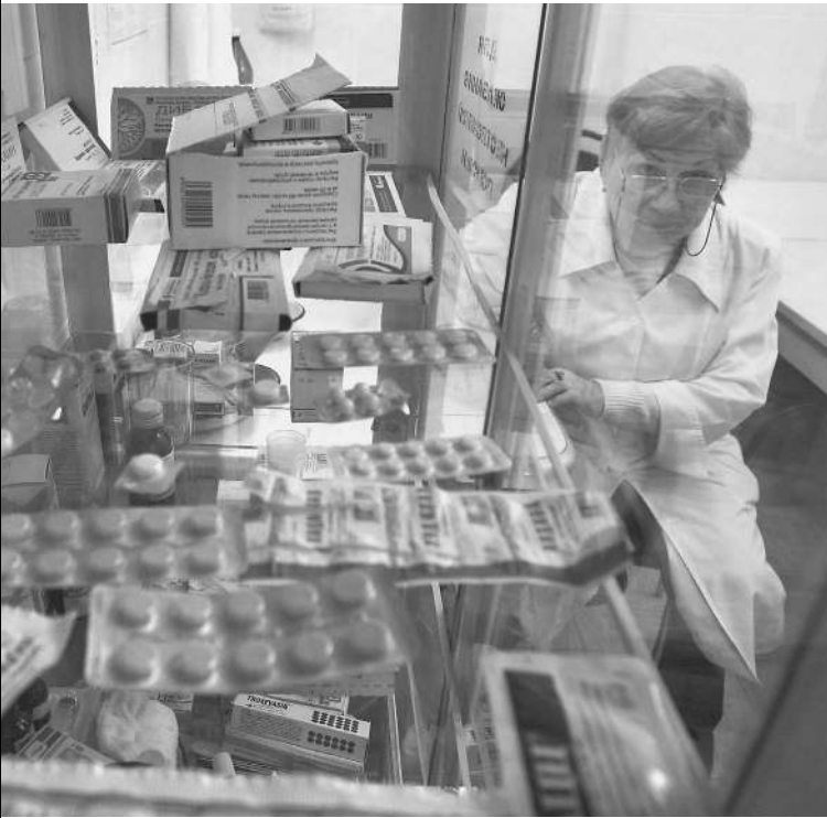
Аптекари стоят перед выбором: повысить цены или не возмущать потребителя

курса валюты — дело неприятное, но хотя бы понятное. Но цены росли и на отечественные препараты, когда и сырье для него тоже было свое, родное — типа салицилового спирта или обычных витаминов. → стр. 3