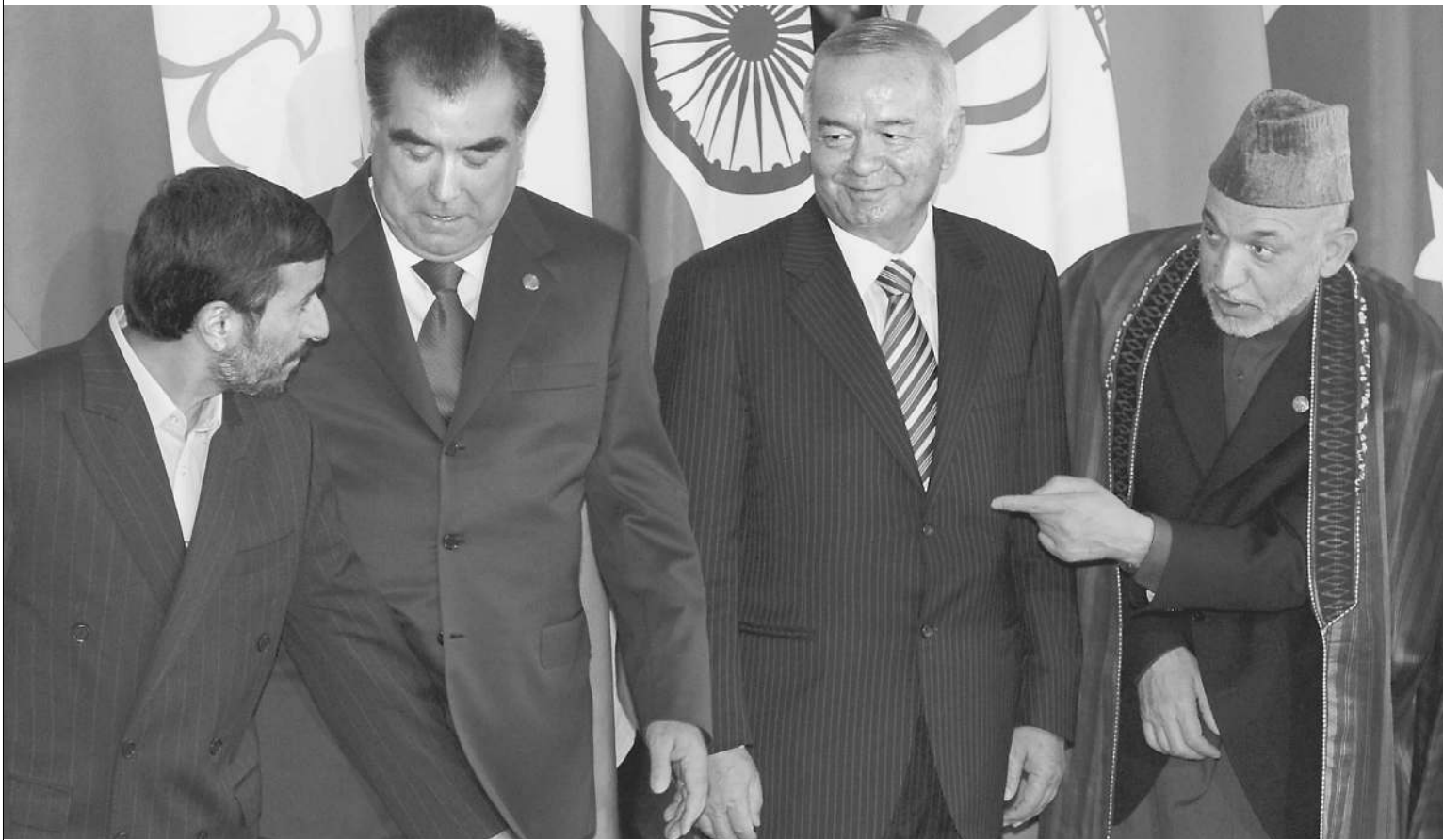
Президент Афганистана Хамид Карзай (крайний справа) очень удивился, увидев Махмуда Ахмадинежада (крайний слева) в Екатеринбурге на саммите ШОС (подробности → стр. 2)

А нестигаемый Махмуд Ахмадинежад все-таки прибыл в Россию