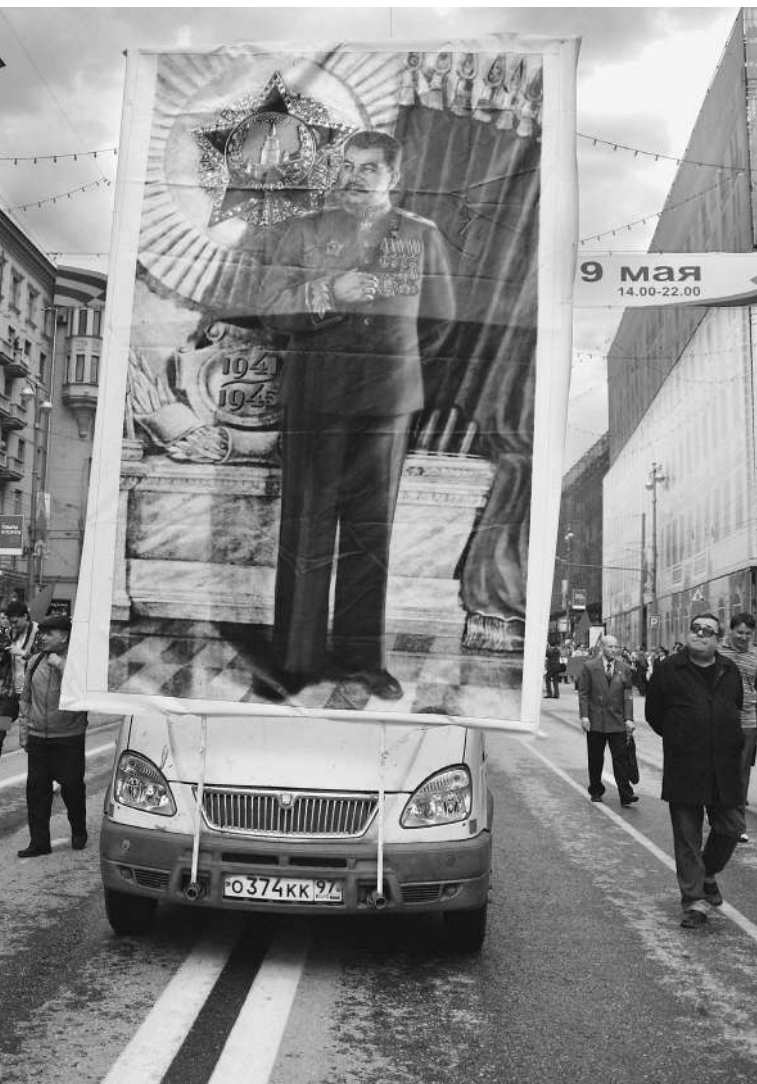
9 мая 2009 года. Шествие КПРФ по Тверской улице

Сегодня «Известия» представляют новую рубрику Pro & Contra. Здесь по острым, возможно, болезненным для российского общества вопросам будут высказываться, оппонируя друг другу, авторитетные эксперты. Истину в их спорах предстоит найти читателю. Премьера рубрики практически совпала с датой, которую многие считают черным днем календаря, но есть и те, кто будет отмечать ее как большой праздник. 130 лет назад, 21 декабря 1879 года, по официальным источникам, родился Иосиф Джугашвили — Сталин. Был ли «отец народов» величайшим монстром в российской истории или политиком, пытавшимся сохранить страну? Руководствовался ли он собственной злой волей или объективными обстоятельствами непреодолимой силы? Об этом в рубрике Pro & Contra дискутируют писатели Святослав Рыбас и Альфред Кох .