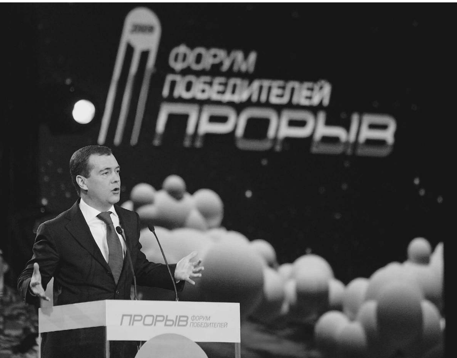
Президент уверен, что благодаря «умной» экономике государство станет другим

Дмитрий Медведев вручил первую молодежную национальную премию