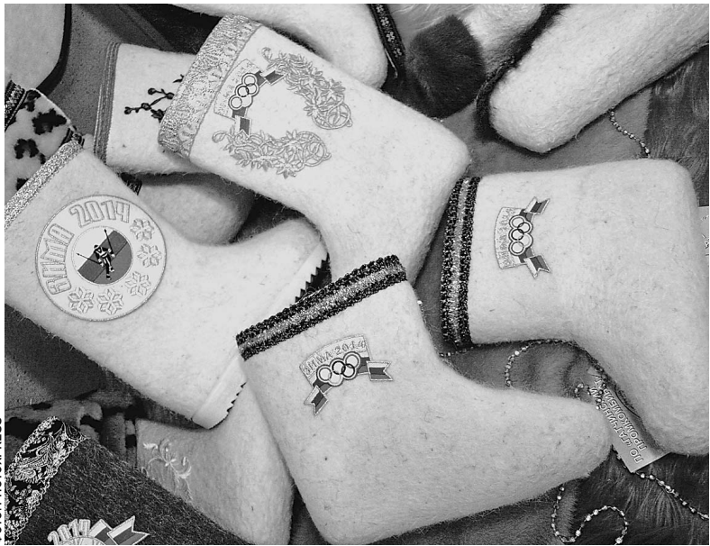
Такие валенки шьются без всякой оглядки на Оргкомитет спортивного праздника