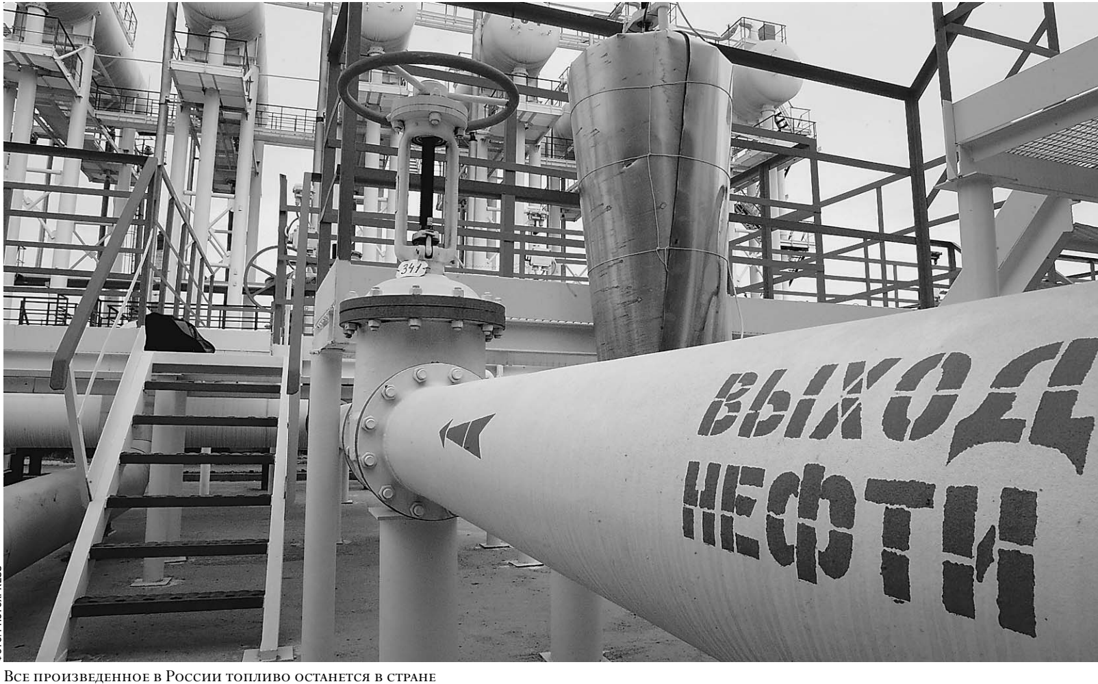
Все произведенное в России топливо останется в стране

Экспорт нефтепродуктов из России закрыт, но цены все равно вырастут