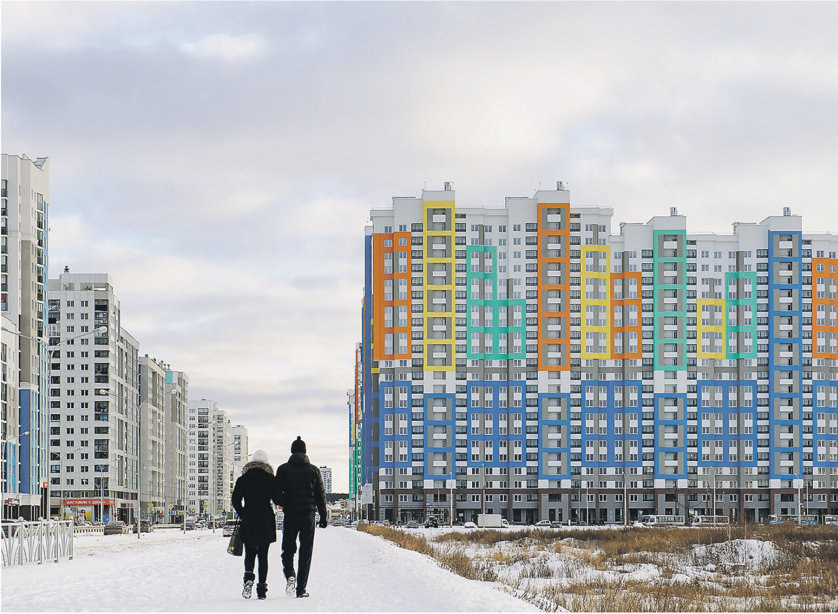
Спрос на жилье останется высоким

Рекордно низкий показатель может быть достигнут уже в этом году