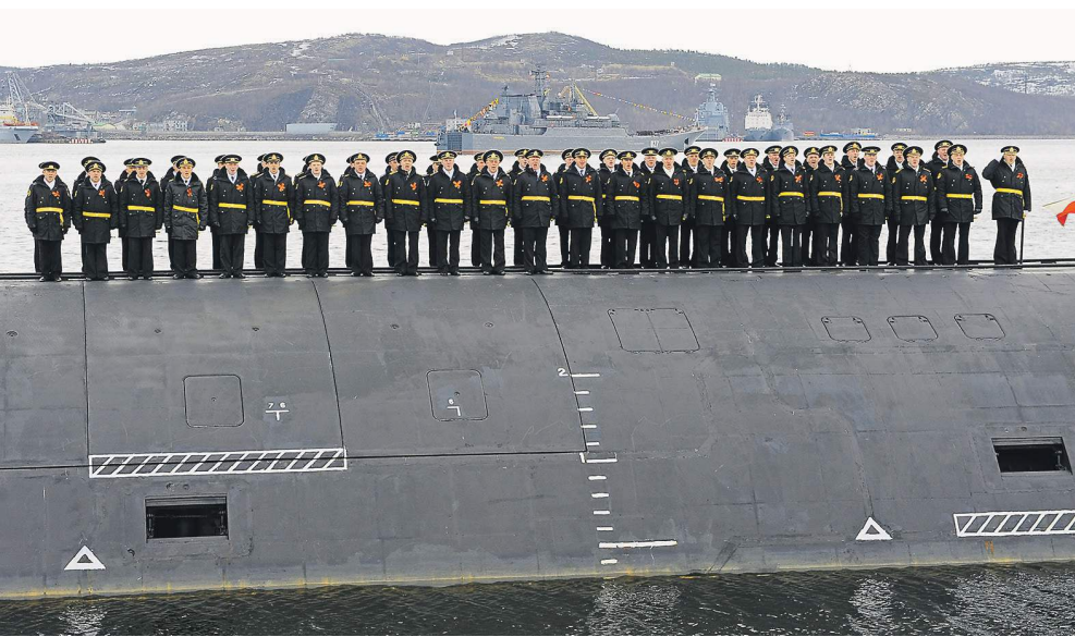
Флоту нужны профессиональные военнослужащие

Как рассказали «Известиям» в штабе Северного флота, начиная с нынешнего года все должности на кораблях и подводных лодках комплектуются исключительно военнослужащими, проходящими военную службу по контракту. Поэтому призывников направят только в части Береговых войск СФ: мото-