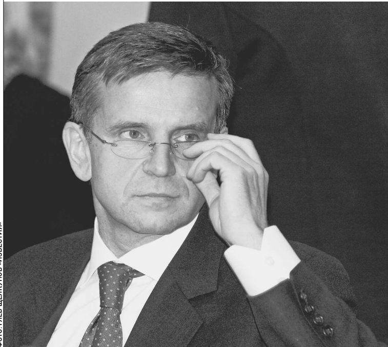
Михаил Зурабов не боится неудобных вопросов. Он просто на них не отвечает

стал советником президента в 2007-м, — Зурабов не был на Охотном Ряду. Впрочем, экс-министра вряд ли замучила nostalgia по Думе — каждый раз во время его визитов к депутатам ему приходилось отбиваться от неудобных вопросов и «потихому» сбегать от журналистов потайными лестницами. → стр. 3