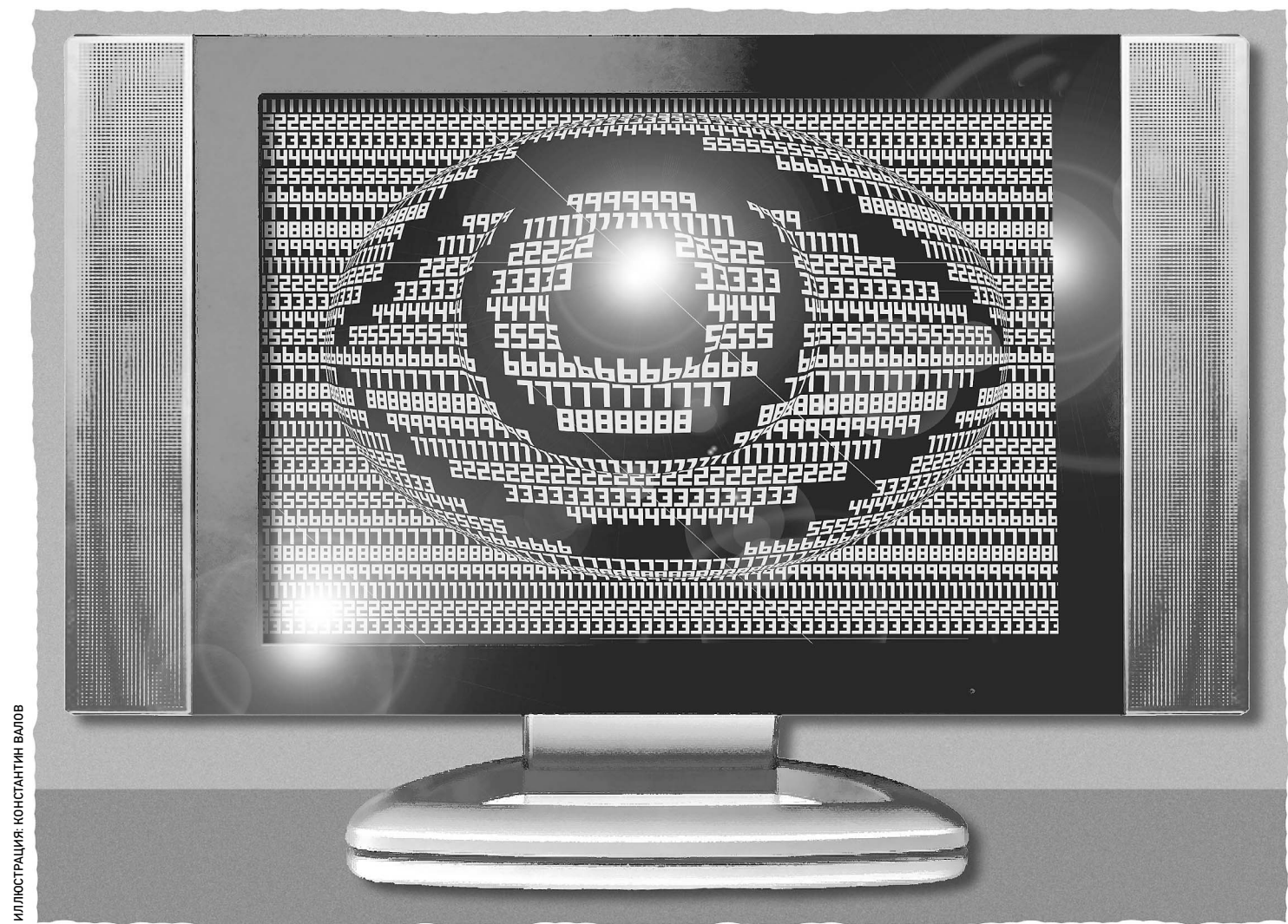
ИЛЛЮСТРАЦИЯ КОСТАДИН ВАЛОВ

Президент утвердил список цифровых каналов, которые можно будет смотреть бесплатно