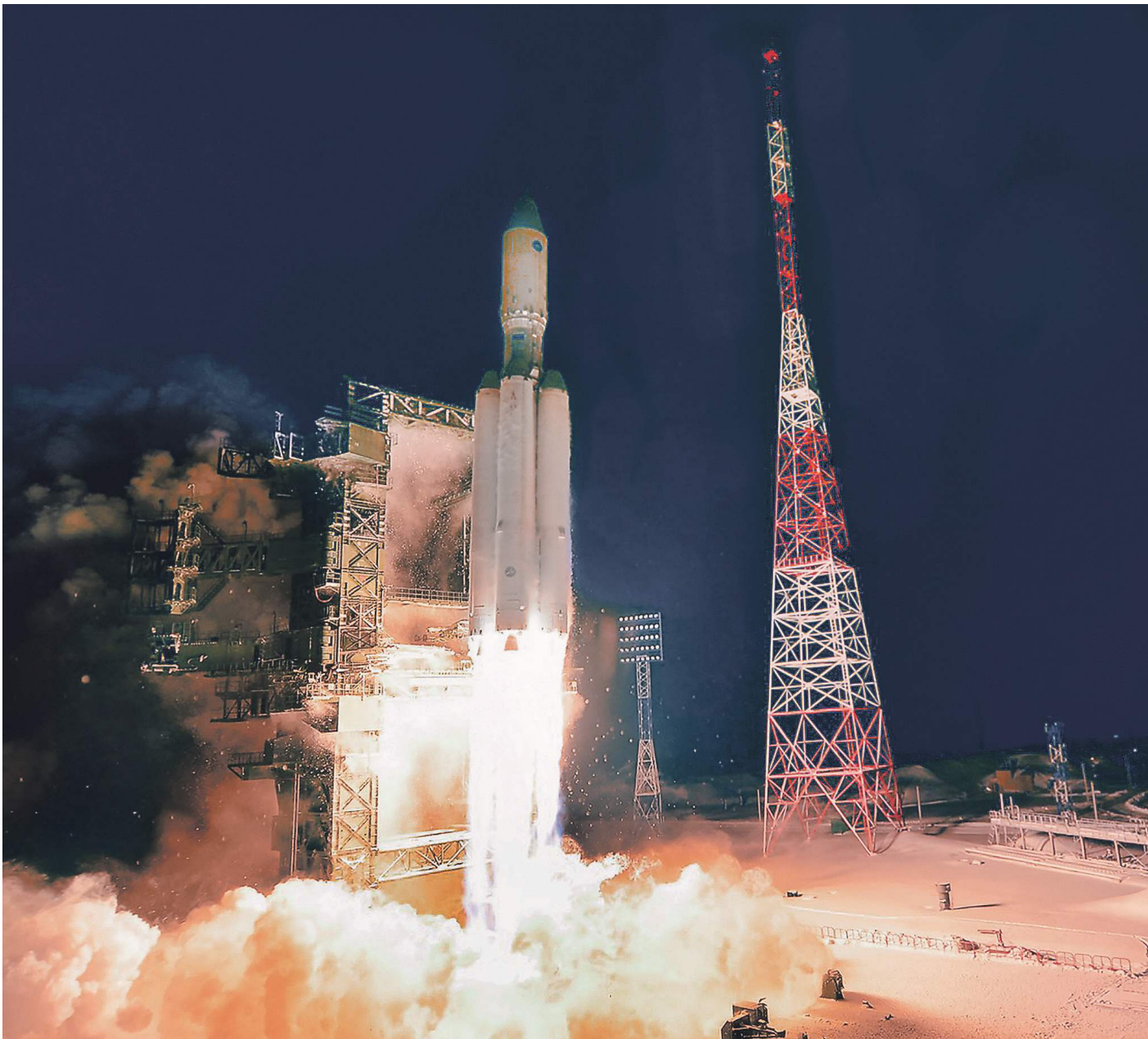
Сегодня «Роскосмос» наиболее значительно представлен на рынке пусковых услуг

В программе до 2050 года должны быть представлены перспективы развития рынка пусковых услуг, пилотируемой космонавтики, включая космический туризм, услуг в области спутниковой навигации и съемки Зем-