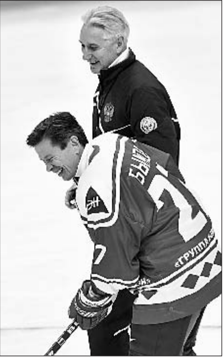
Зинэтула БИЛЯЛЕТДИНОВ пока, увы, идет по пути Вячеслава БЫКОВА, накануне Олимпиады превращая свой штаб в наглухо закрытую лабораторию.