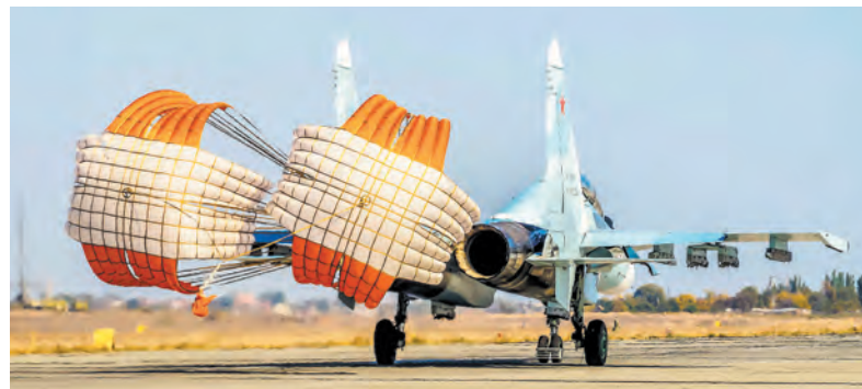
Выполнив задачи, самолёты вернулись на «родные» аэродромы

Самолёты оперативно-тактической авиации ЗВО из Тверской, Астраханской, Курской, Воронежской областей и Республики Карелия, отрабатывая единый замысел тактических учений – один из самых сложных элементов учения, выполнили единую огневую задачу разнотипной авиационной группировкой.