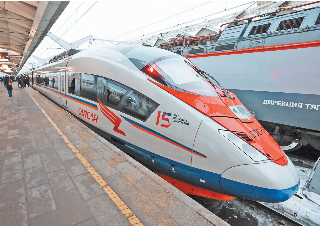
В модернизированном «Сапсане» девять классов обслуживания. Особенно ярко выделяется вагон семейного класса. Дети в нем могут хоть всю дорогу смотреть мультфильмы и играть на приставках, а родители в это время — отдыхать.