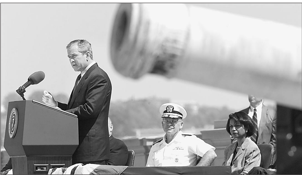
Джордж Буш-младший: «Договор по ПРО — прибежище прошлого»