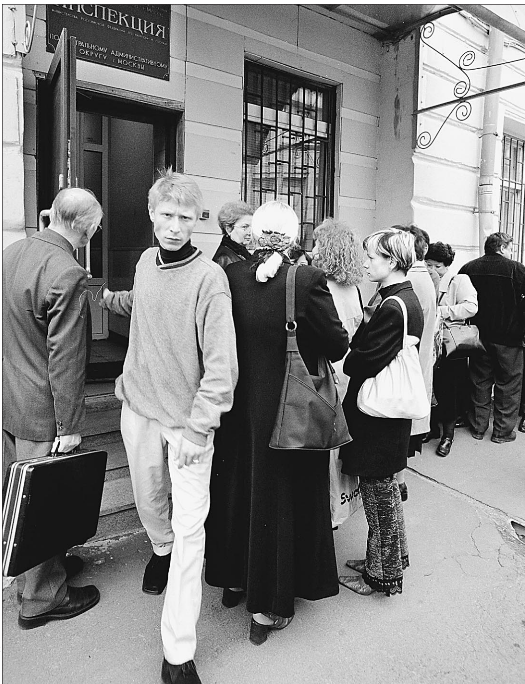
Чтобы подать налоговую декларацию, надо предпринять усилия