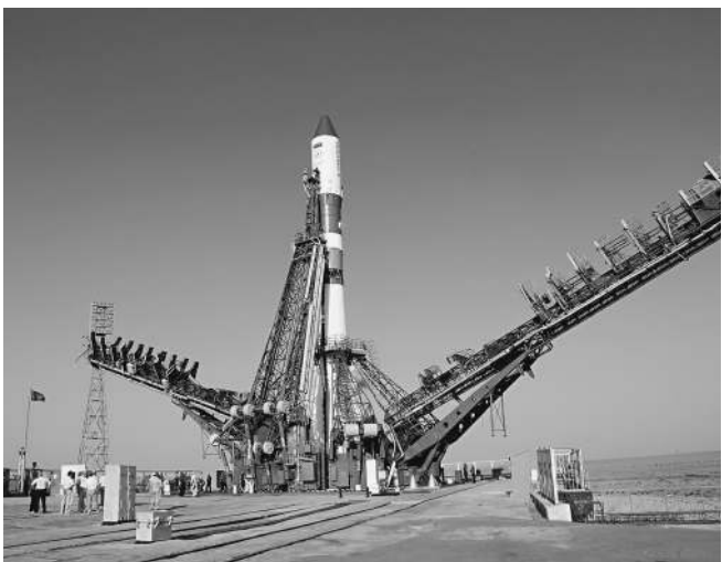
Прокурорам приходится осваивать профессию технических экспертов