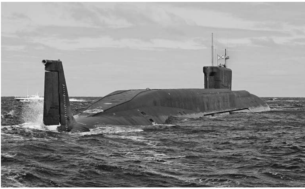
Штатный носитель «Булавы» — «Юрий Долгорукий» — со своей задачей справился