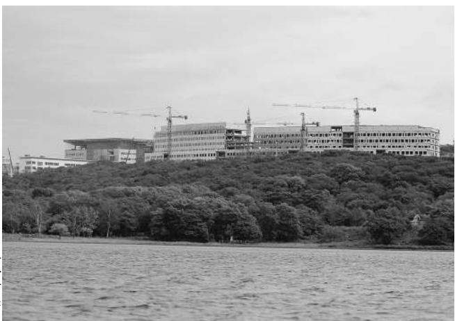
Масштаб строительства таков, что многие проверки затягиваются

«Очистка дна — архиважное мероприятие, необходимое для безопасности судоходства. В молодые годы мы как-то расчищали Сталинский залив (сейчас — залив Панфиловцев. — «Известия»), и мои водолазы работали несколько месяцев, а тут глубина выше, так что только верить остается — выполнены ли реально работы или нет, — сетует депутат. — При этом нужно дополнительно мониторить дно