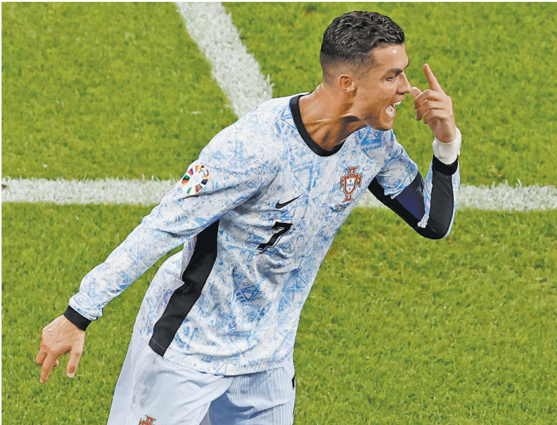
Вчера. Гельзенкирхен. Грузия – Португалия – 2:0. Криштиану Роналду и его партнеры не смогли пройти групповой турнир без поражений

Вчера окончательно определились все участники плей-офф чемпионата Европы.