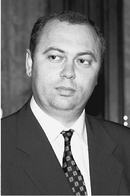
Бывший министр обороны Молдавии Валерий Пасат обвиняется в продаже МиГов США