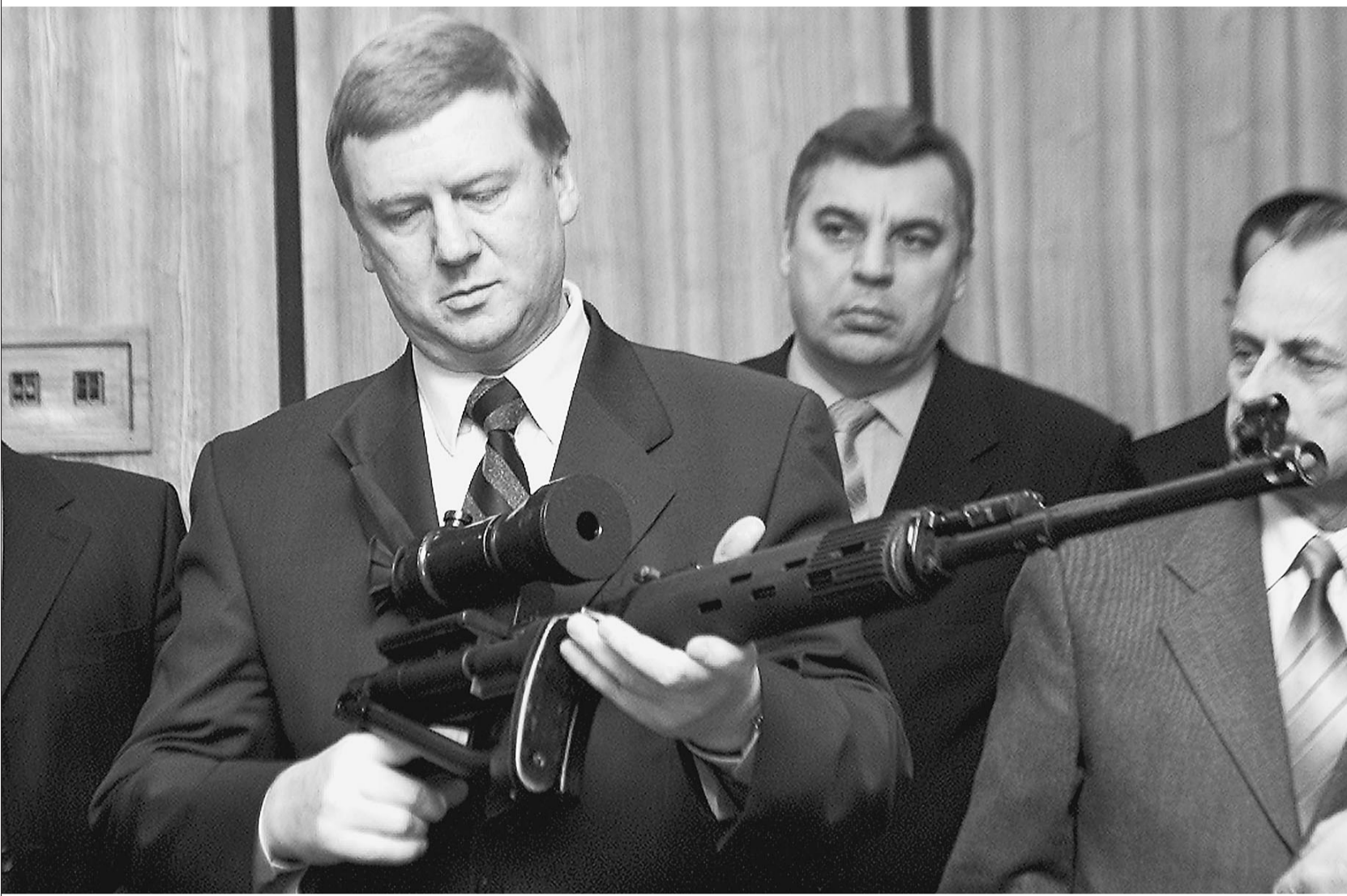
Глава РАО «ЕЭС» готов бороться за освобождение своего коллеги