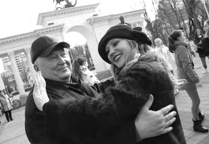
«Случайный вальс» – это память о подвигах участников Великой Отечественной.