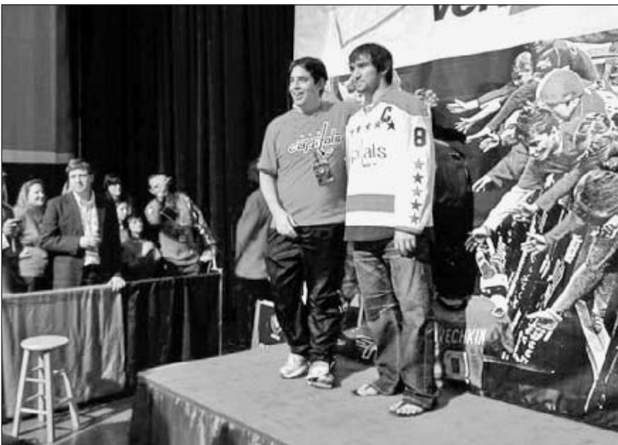
Вчера, Арлингтон. Презентация нападающего «Вашингтона» Александра ОВЕЧКИНА.

Вчера свою первую тренировку в «Вашингтоне»-2013/14 провел капитан команды Александр Овечкин, которого молва отправляет в московское «Динамо»-2014/15. Подробности - в интервью суперзвездного легионера, которое он вчера вечером дал спецкору «СЭ».