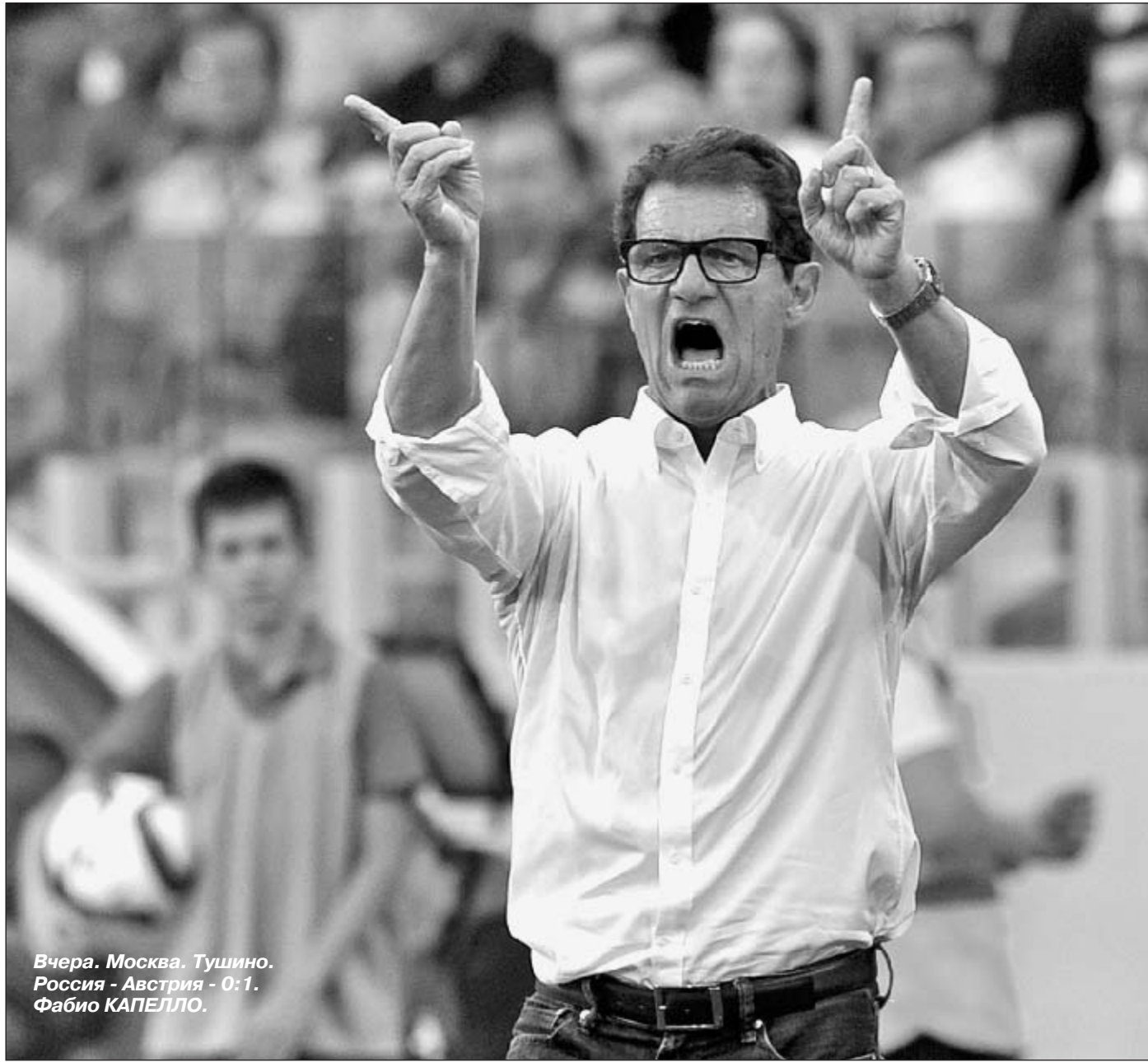
Вчера. Москва. Тушино. Россия - Австрия - 0:1. Фабио КАПЕЛЛО.

Конечно, новый тренер не наколдует для России новых форвардов или защитников. Но по крайней мере у нас снова появится хоть какая-то надежда. А сейчас, с Капелло, никакой надежды и в помине нет.