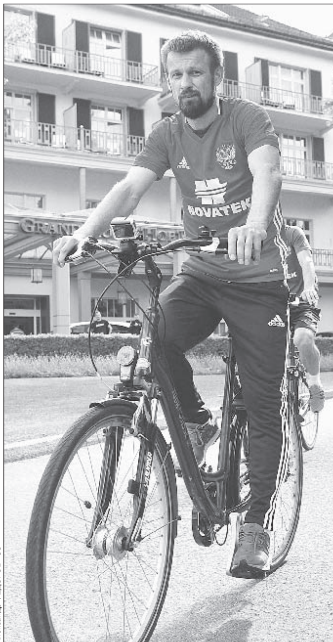
Вчера. Бад Рагац. Сергей СЕМАК направляется на тренировку сборной России.