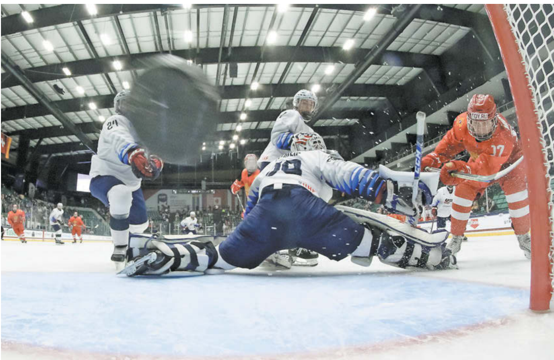
Вчера. Фриско. Россия–U18 – США–U18 – 7:6 ОТ. Одна из шайб в ворота американцев